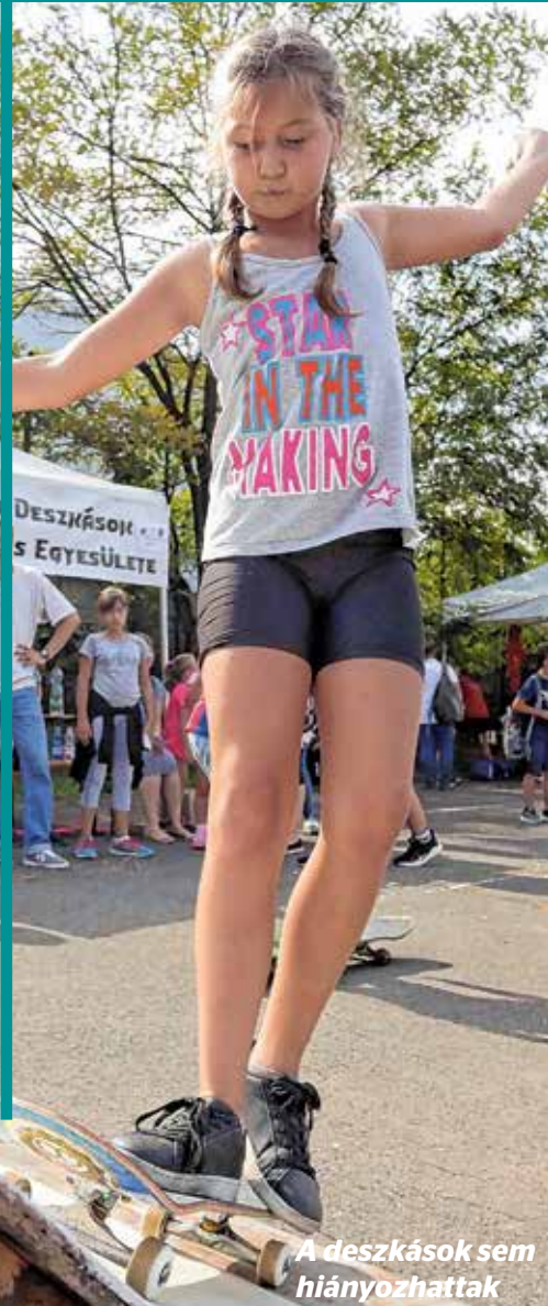
A deszkások sem hiányozhattak

A magyar szabadidősport egyik legnagyobb rendezvénye nemcsak több ezer érdeklődőt és sportolni vágyót vonzott, hanem megdöntötte az egy időben egy helyen üzött sportágak kategóriájának rekordját is.