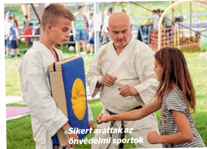
Sikert arattak az önvédelmi sportok

A rendezvény célja, hogy mozgásra buzdítson mindenkit, illetve segítsen az egyéni adottságokhoz és igényekhez illő sportágak megtalálásában. Az amatőr sportolók összesen 104 mozgásformát próbálhattak ki in-