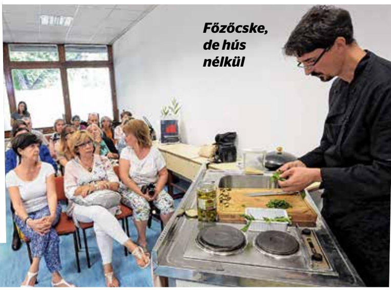
Főzőcske, de hús nélkül