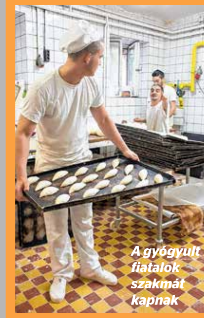
A gyógyult fiatalok szakmát kapnak

Kőbánya a jövőben is megbízható partnere marad a drogok és a függőségek ellen küzdő civil szervezeteknek. A felvilágosító munkát, megelőzést és rehabilitációt végző szervezeteket a kerület rendszeresen támogatja, így felkarolja többek között a veszélyeztetett fiatalok, családok számára segítséget nyújtó Életrevaló Karitatív Egyesület kezdeményezéseit, de a hajléktalankok, rászorulókat ellátását végző Baptista Szolgáltató Centrum működését is segíti anyagilag. Kiemelkedő munkát véggez az Emberbarát Alapítvány