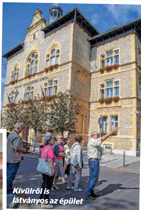
Kívülről is látványos az épület

dekkességet tudtak meg. A hivatalnokok egészen az 1840-es évekig forgatták vissza képeztetben az idő kerekét, s sztoriztak attól a kortól kezdve, amikor Kőbányán elindul a robbanásszerű fejlődés. Sokan ámulva hallgatták, hogy az épület egy része 1932-ig paplak volt, s Krúdy Gyula, Móra Ferenc, de még Gárdonyi Géza is megfordult benne – utóbbi például szellemet idézett az ódon falak