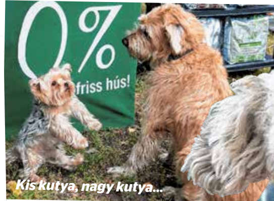
Kis kutya, nagy kutya...

Már a reggel tízórás megnyitótól több mint száz szülő, gyerek és persze családi kedvenc lepte el a Népliget Planetárium melletti részét a VI. Örökbefogadott Állatok Napján. A szakmai egyesületek sátraiban az érkezők a kóbor állatok örökbefogadásáról, a felelős állattartásról tájékozódhattak, de a nap folyamán számos program is színesítette a kutyás (és kisebb részben macskás) találkozóvá duzzadt rendezvényt.