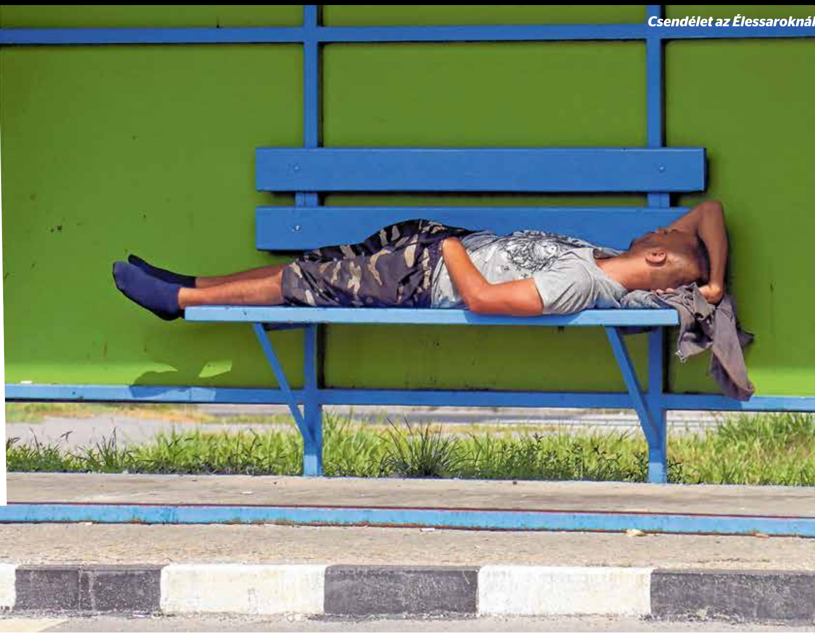
Csendélet az Élessaroknál

drogok is. Éppen ezért a mostani események csak újra rávilágítanak arra, amit a Kőbányai Önkormányzat évek óta mond: a helyzet megoldásának kulcsa a problémás tömbök teljes szanálása.