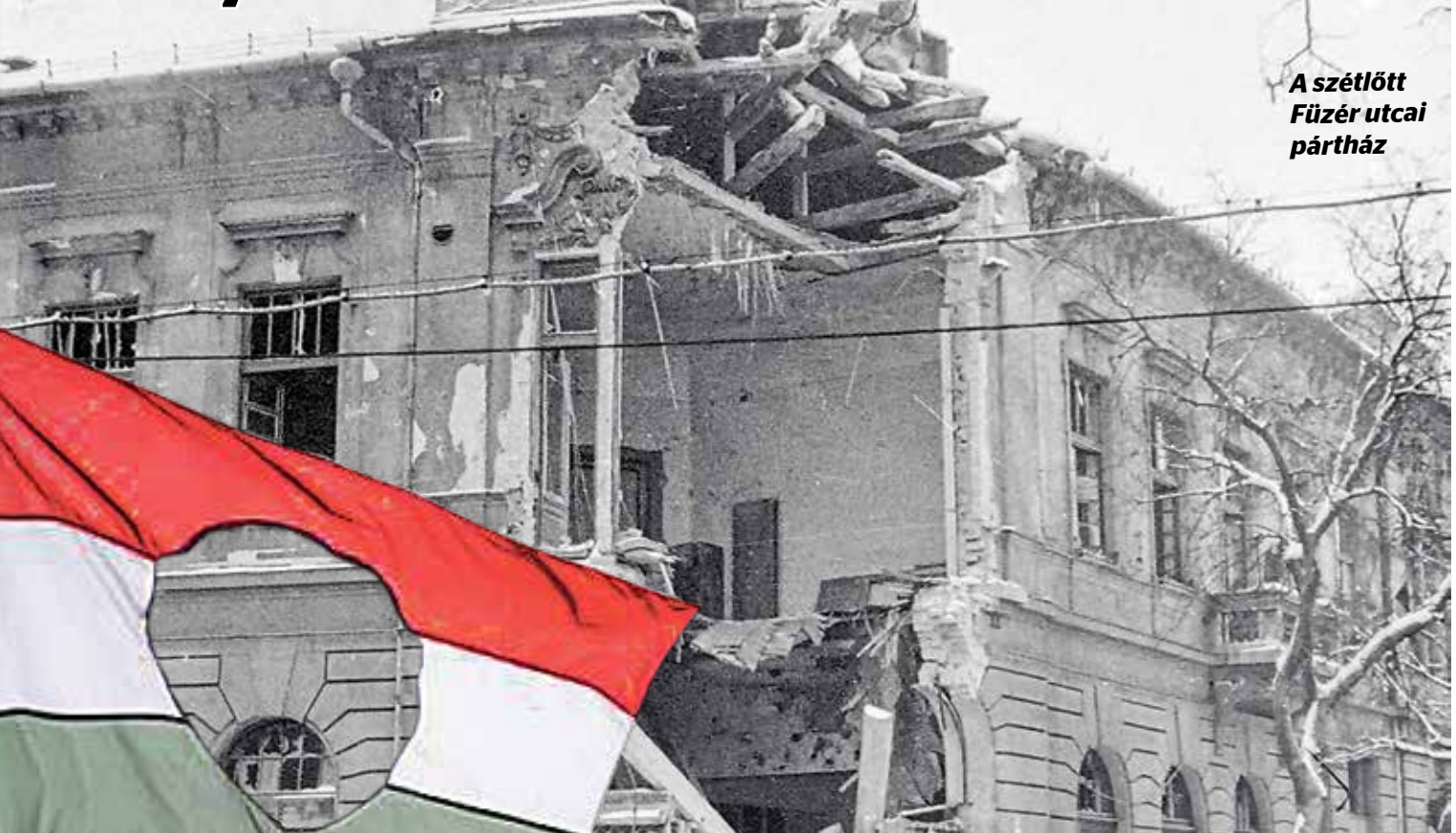
A szétlőtt Füzér utcai párház