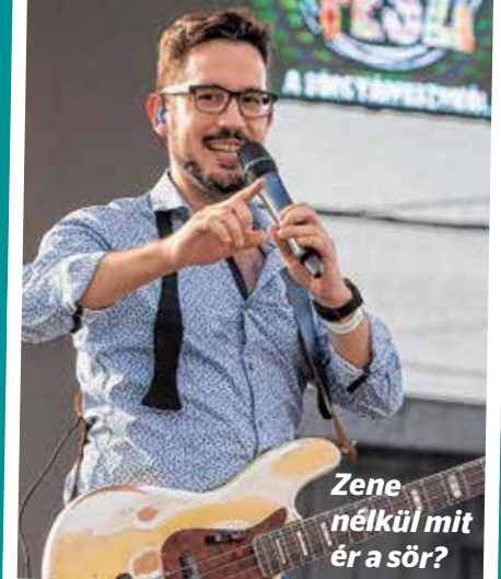
Zene nélkül mit ér a sör?

Ötödik alkalommal nyitotta meg kapuit a Dreher Sörgyárak a tömegek előtt, hogy egy felejthetetlen estén, számos feltörekvő és már befutott zenekarral kísérvé, világos és barna, illetve trópusi gyümölcsökkel ízesített alkalmi sörkülönlegességeket kortyolgtatva búcsúzzunk a nyártól. Jöttek is a sörbarátok ezerszám a DreherFesztre, megtöltve a gyárudvart. A mini sörgyártúrán be-