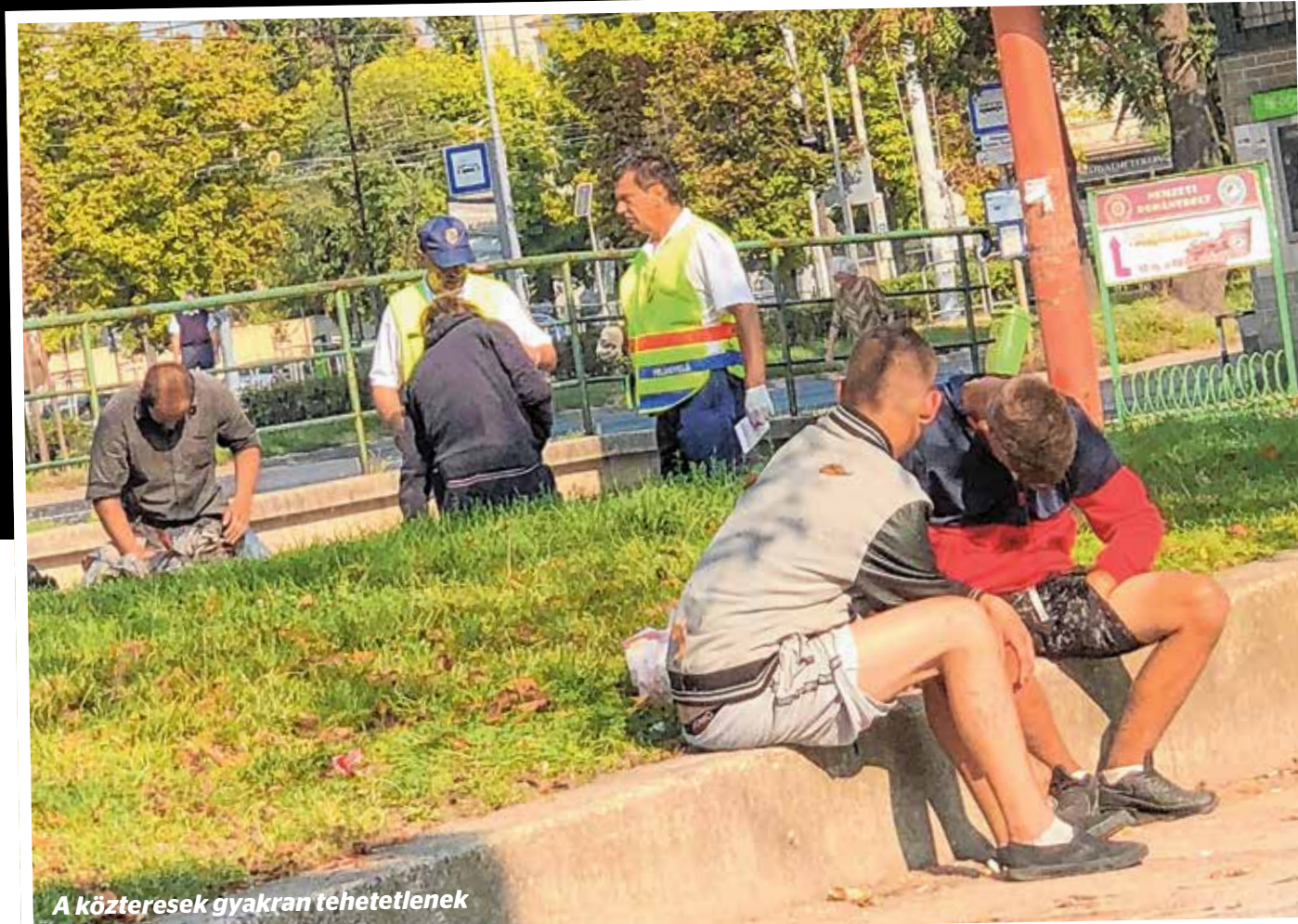
A köztereken gyakran téhetetlenek

Az elmúlt hetekben újra számtalan tudósítás, felvétel, fénykép jelent meg Kőbányai közterein ájul­tan fekvő vagy öntudat­lan állapotban dülöngélő fiatalokról. A droghelyzet nemcsak a kerület problémája, a Hős utca 15.-ben árult bódító szerek miatt a szomszéd kerületeket is ellepték betépett emberek, akik gyakran „drogturisták”, hiszen jelentős részük a város más részéből érkezik.