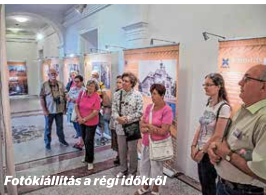
Fotókiállítás a régi időről

A kellemes sétát az újonnan kialakított belső átriumban megtartott két koncert is színesítette, miközben a körömsétélő látogatók rengeteg ér-