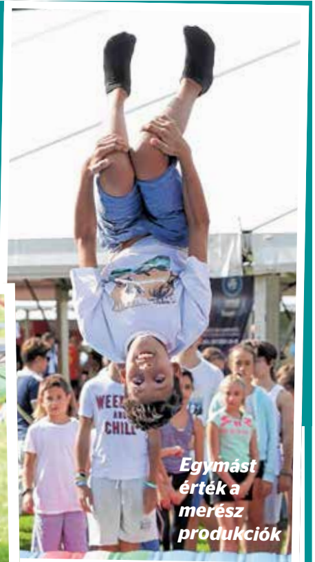
Egymást érték a merész produkciók

Főigazgatóság visszatérő vendégként volt jelen. A szervezet tűzmelegelőzéssel foglalkozó edukációs programjait kíváncsian fogadták a gyerekek: mindkét napon felkesen sorban álltak, hogy beléphessenek a füstátorba, és kipróbálhassák, milyen érzés a tálcátűzoltás.