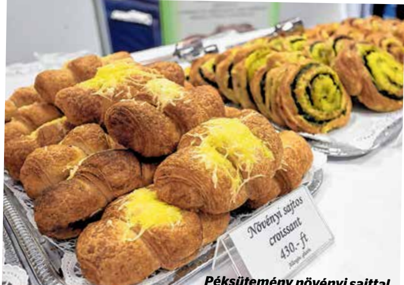
Péksütemény növényi sajttal

Nemcsak az állatok tisztelése és szeretete, de ökológiai és egészségügyi okok is szólnak a húsmentes élet mellett.