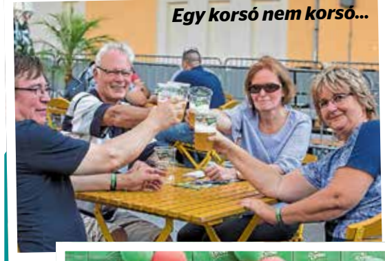
Egy korsó nem korsó...

Ötödik alkalommal nyitotta meg kapuit a Dreher Sörgyárak a tömegek előtt, hogy egy felejthetetlen estén, számos feltörekvő és már befutott zenekarral kísérvé, világos és barna, illetve trópusi gyümölcsökkel ízesített alkalmi sörkülönlegességeket kortyolgtatva búcsúzzunk a nyártól. Jöttek is a sörbarátok ezerszám a DreherFesztre, megtöltve a gyárudvart. A mini sörgyártúrán be-