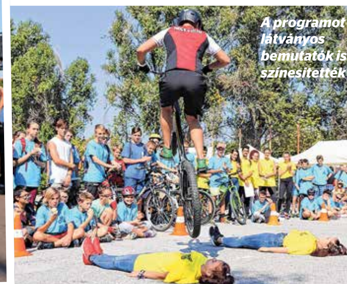
A programot látványos bemutatók is színesítették

Újra háttérbe szorultak egy hétre az autók: Kőbánya idén is csatlakozott az Európai Mobilitási Héthez. A kezdeményezéshez kapcsolódva minden korosztály találhatott magának olyan autómé-