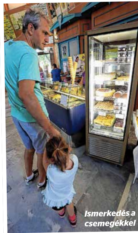
Ismerkedés a csemegékkel