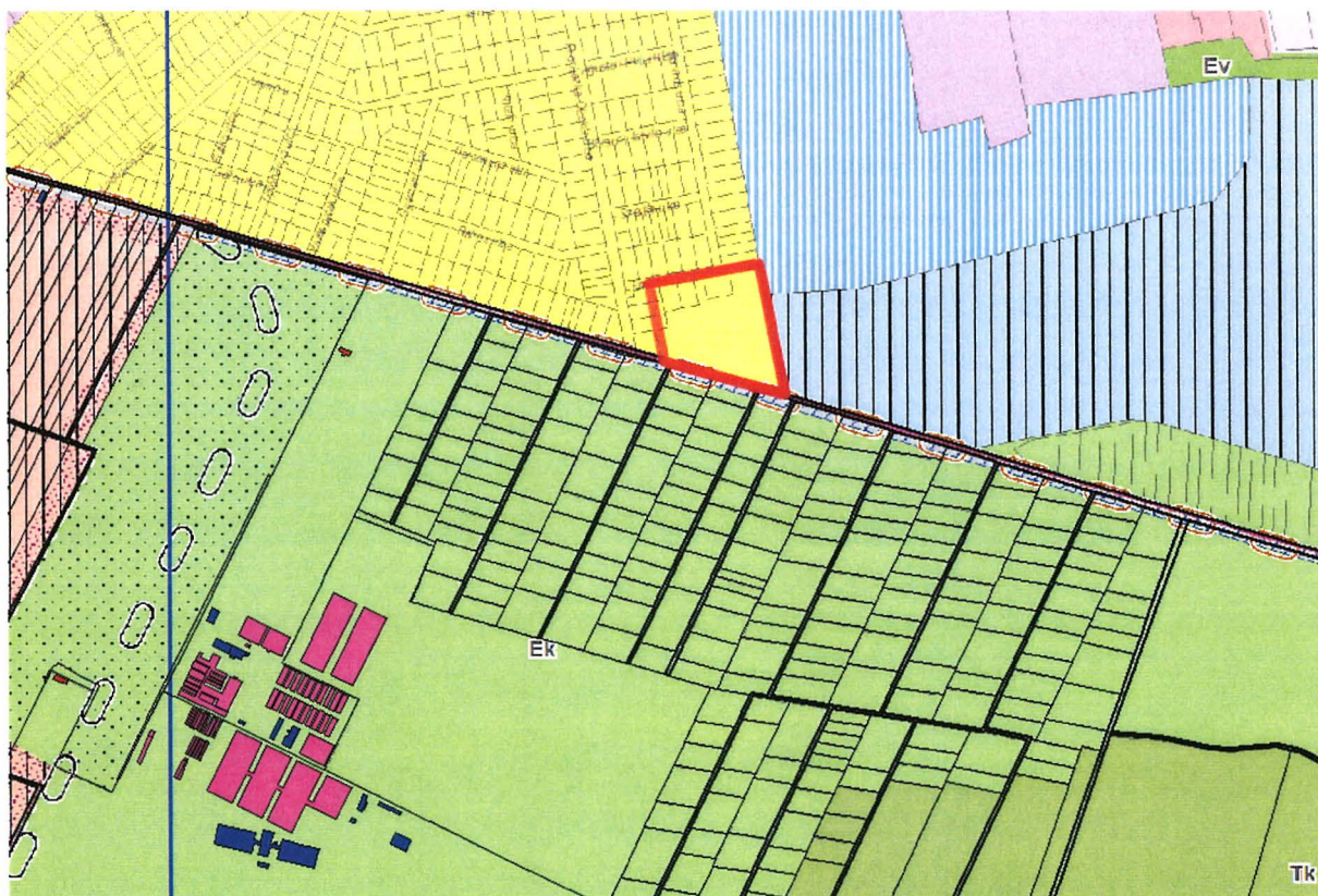
Lke-1 Kertvárosias, intenzív beépítésű lakóterület

A jelenleg Lke-1/XVI/SZ3 jelű övezetbe tartozó területek beépítési paramétereit az alábbi táblázat zölddel jelölt sora tartalmazza. Az övezetváltozást követően a terület az Lke-1/XVI/SZ7 jelű övezetbe kerülne, amelynek a paramétereit a pirossal jelölt sor tartalmazza.