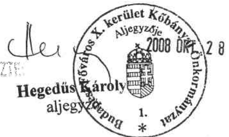
Hegedűs Károly aljegyző