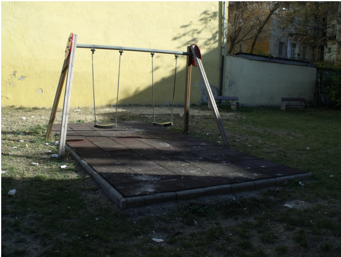
Fokos utcai játszótér