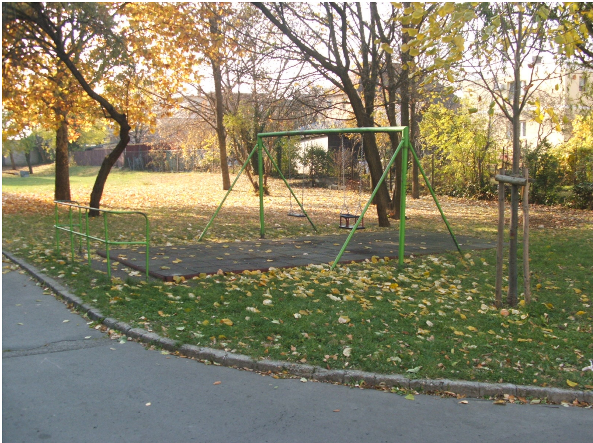
Csombor u. 9.