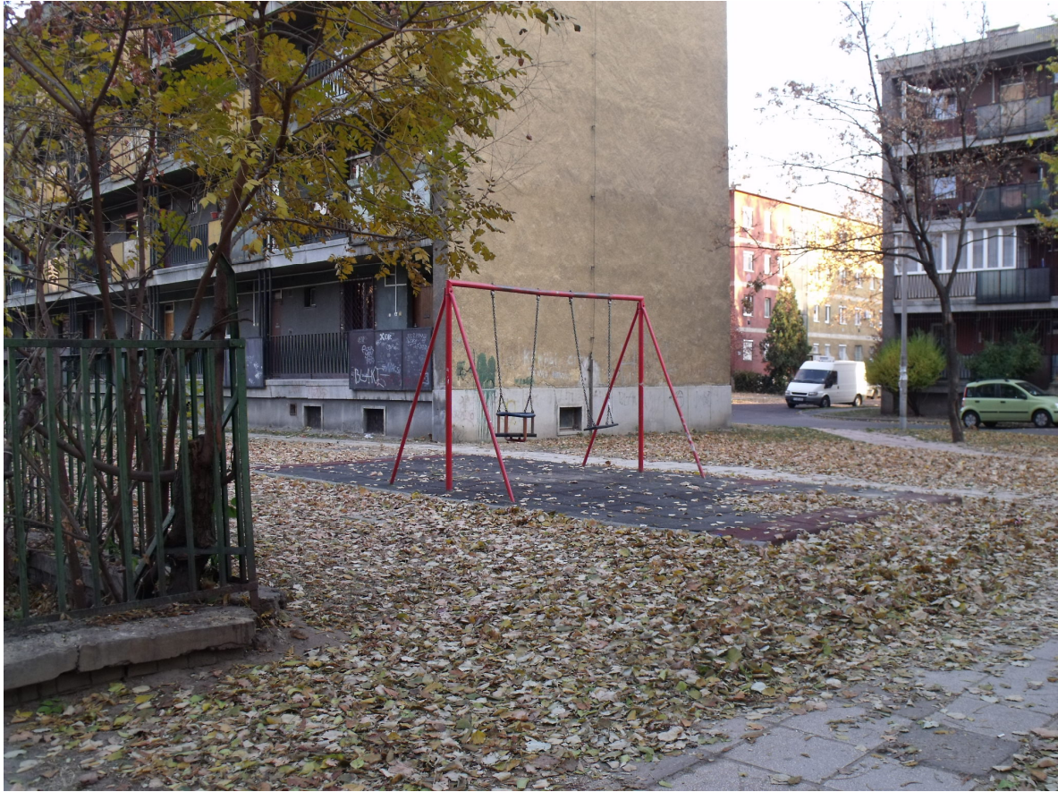
Veszprémi u. - Kőrösi u. 11.