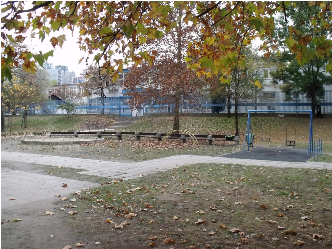
Gyakorló u. 7-9.