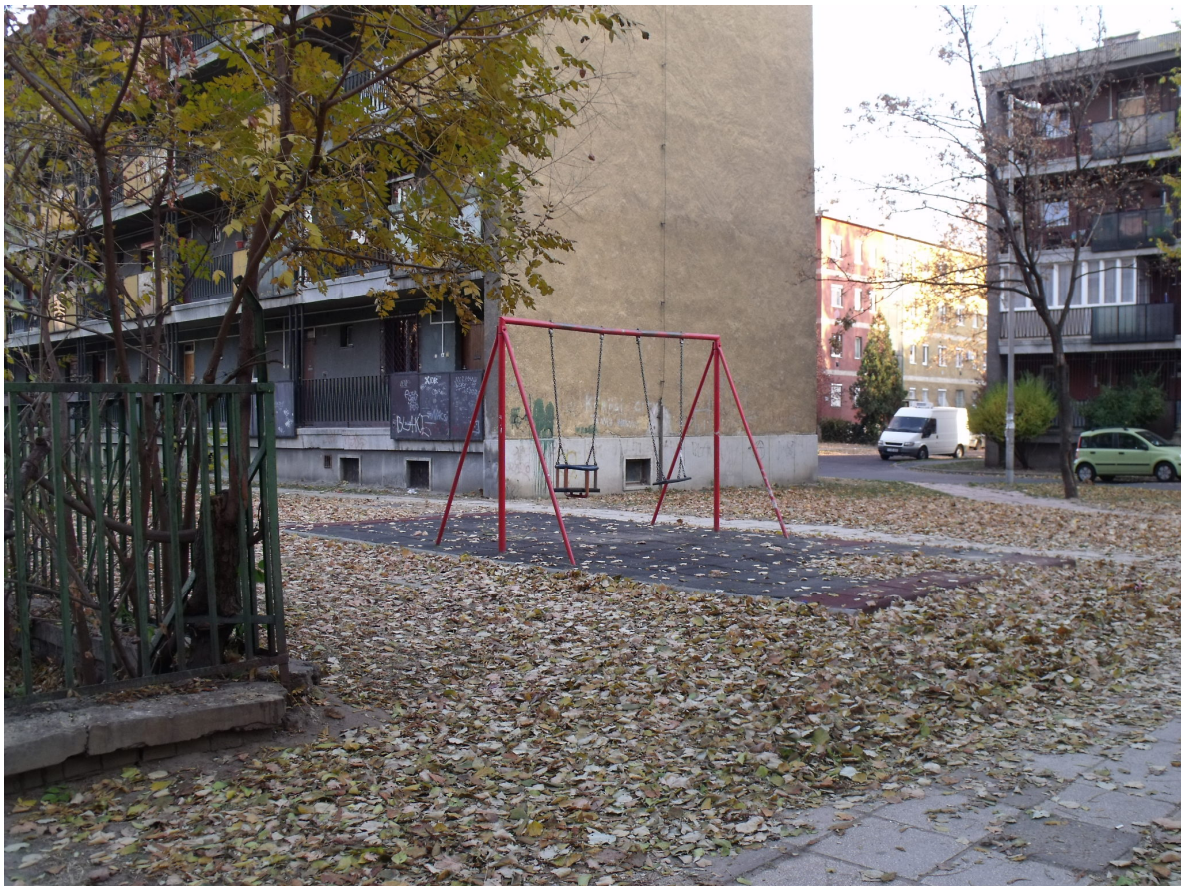
Veszprémi u. - Kőrösi u. 11.