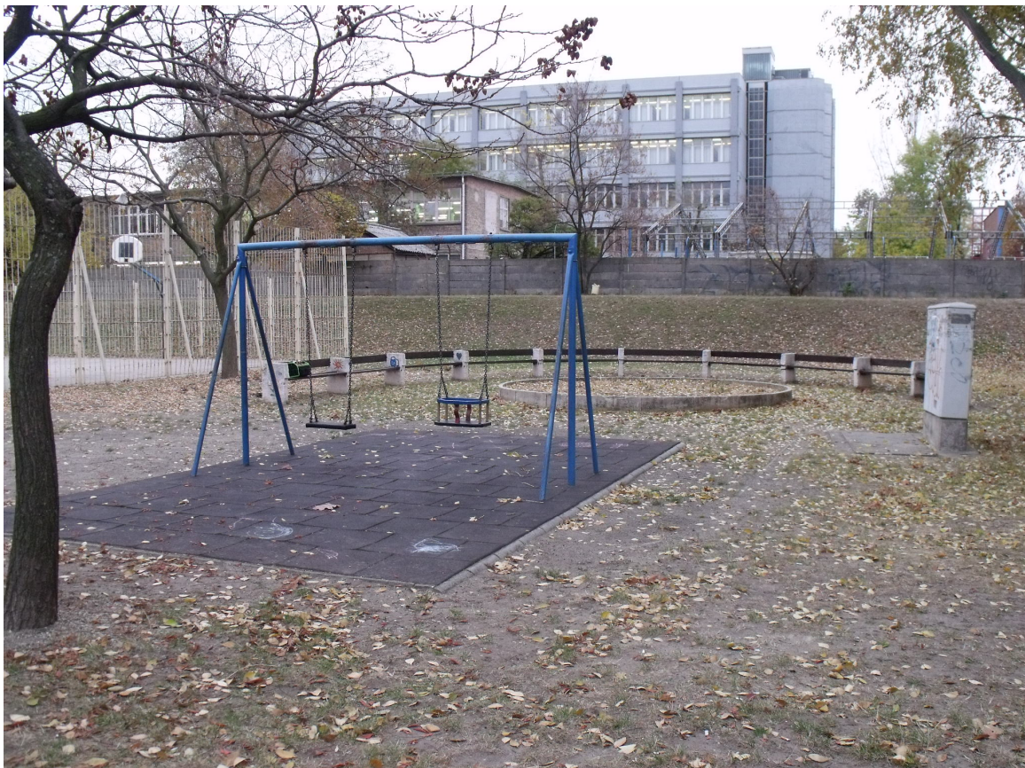
Gyakorló u. 11-13.