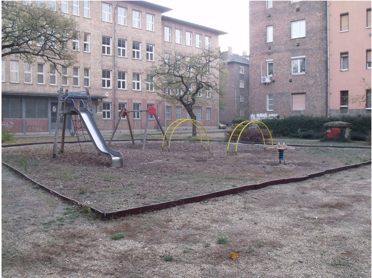
Pongrác u. 9.