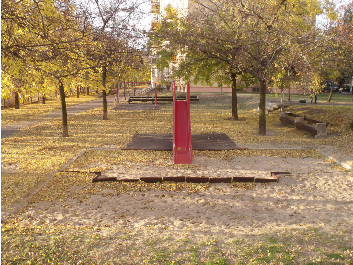
Somfa köz 13-15.