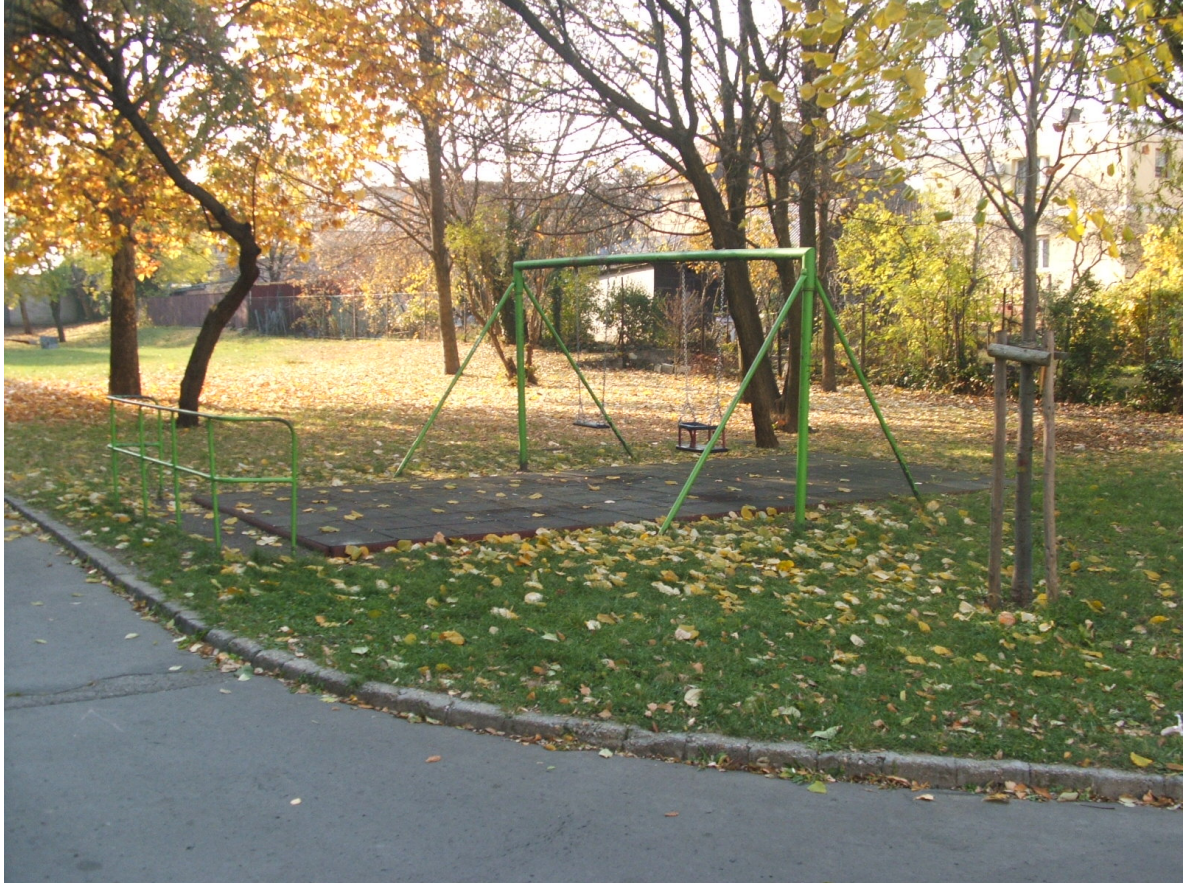
Csombor u. 9.