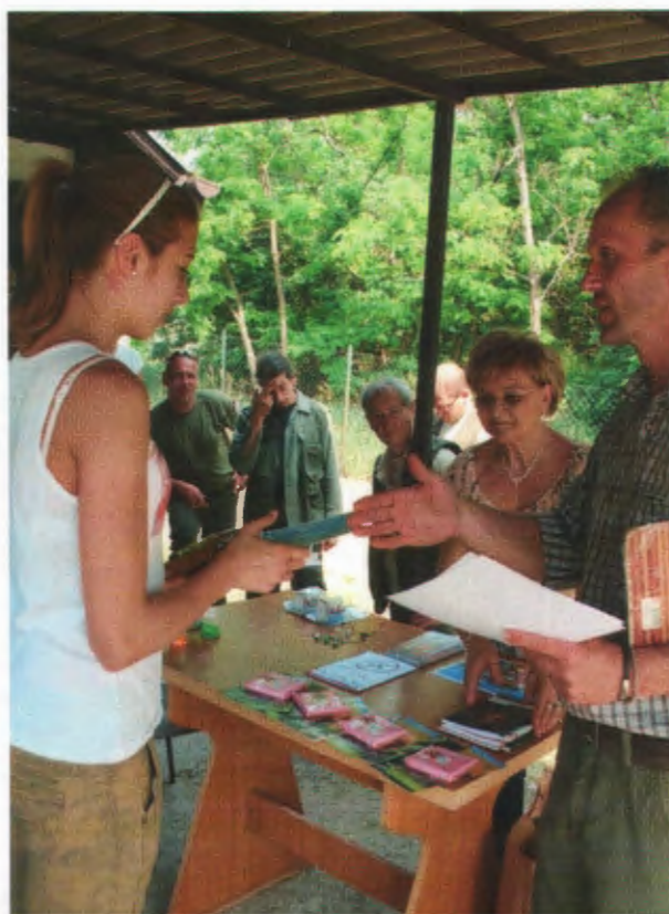
Oklevelet minden résztvevő kapott