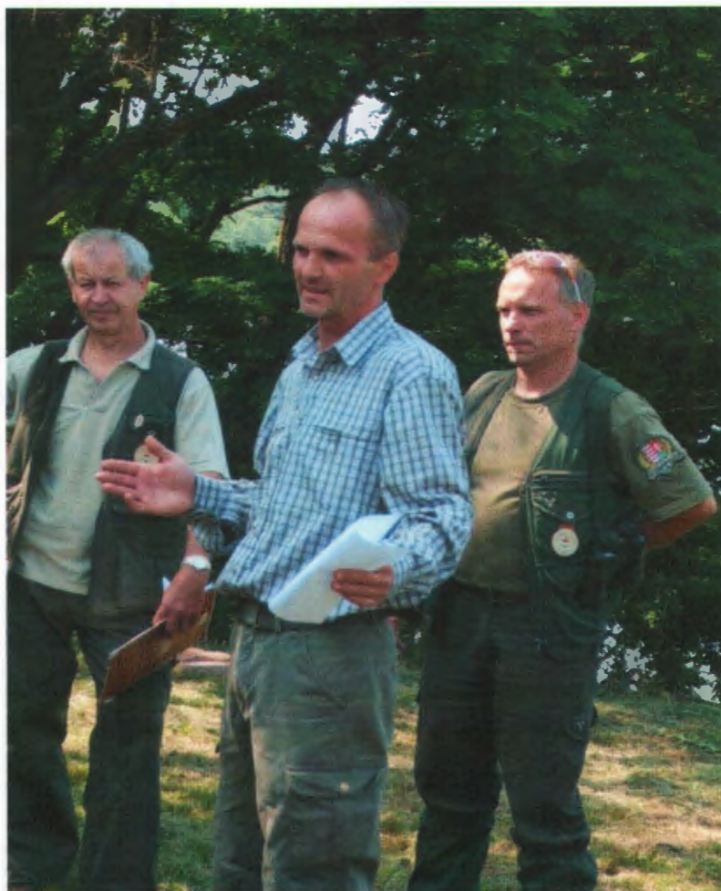
Az intézmény rövid bemutatása a környezetvédelmi vetélkedő előtt

Nagy örömünkre szolgált, hogy a következő hónapban április 28-án ismét átadásra került egy tanösvény a XVII. kerületben a Merzse-mocsárnál.