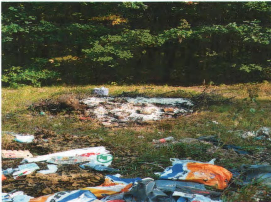
Kábel égetés nyomai

Működésünk 3 éve során közel 448 intézkedés történt, ebből 28 tüzeset, 32 terménylopás 226 tiltott helyen való hulladéklerakás, 128 falopás, 34 kábelégetés. Minden esetben értesítettük az illetékes önkormányzat szabálysértési csoportját, illetve az illetékes rendőrkapitányságot. A tüzesetek nagy része öngyulladás volt, de tapasztaltunk szándékos hulladékégetést is.