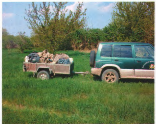
Az „ottfelejtett” hulladékokat rendszeresen elszállítjuk

Szolgálatunk egyéb olyan tevékenységeket is fontosnak tart ami nem kapcsolódik szorosan a munkánkhoz, de környezetünk természeti értékeinek bemutatása érdekében tanösvények létesítését tűztük ki célul. Az első ilyen jellegű projekt a XVI. kerületben valósult meg a Naplás-tó körül, ennek ünnepélyes megnyitója 2012. március 17-én volt.