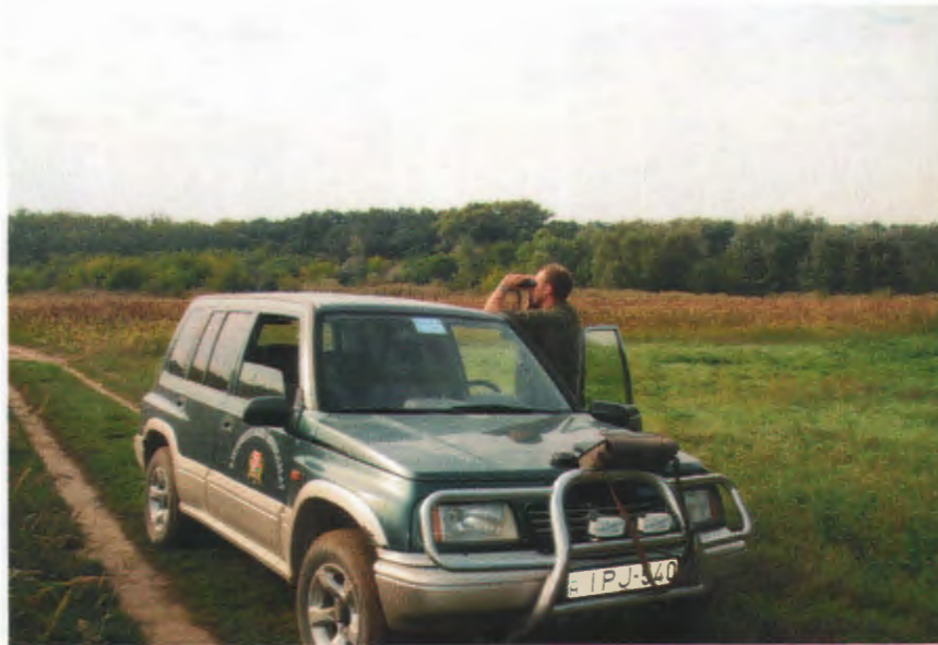
Mezőőr kollégáink a nap 24 órájában teljesítenek szolgálatot

Az elmúlt három évben a Rákosmenti Mezei Őrszolgálatnak bőven akadt munkája a rábizott külterületek őrzését illetően. A közel 6 500 hektáron működő őrszolgálat feladatának tekinti az illegális szemetelők és téli tüzelőt az erdőkből önkényesen beszerző fatolvajok elfogását is.