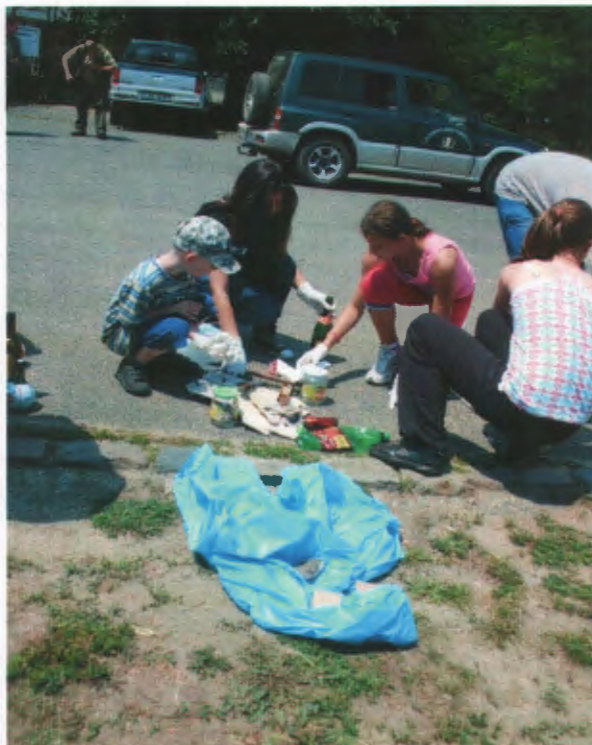
A szelektív hulladékgyűjtés gyakorlatát fontosnak tartjuk, főleg a gyerekek számára