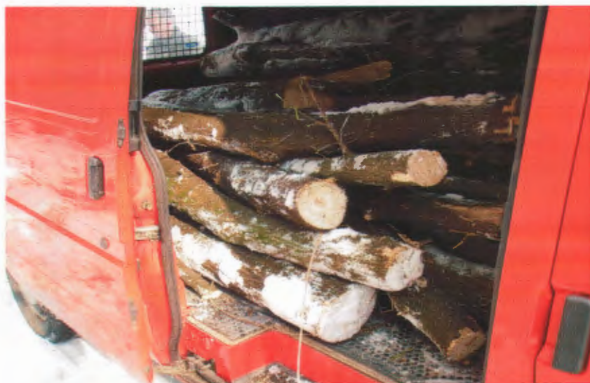
Meghíusult falopás 1.