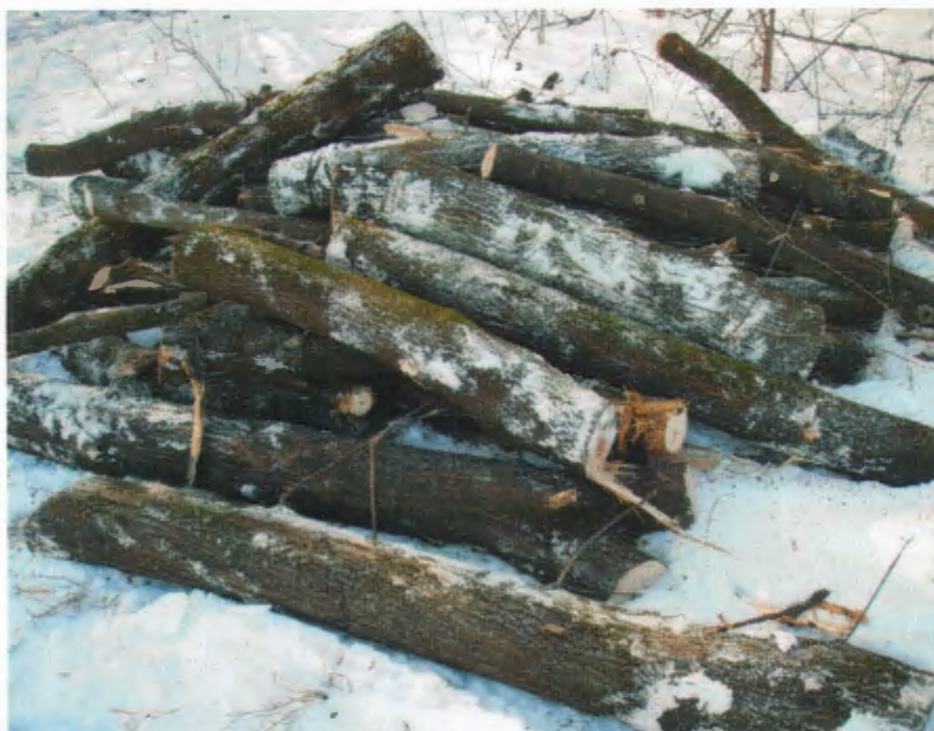
Meghíusult falopás 2.

Intézkedéseink elsősorban járőrözéseink, továbbá terület megfigyelések alkalmával, másrészt lakossági bejelentések alapján történnek. Nagy örömünkre szolgál, hogy a kerületek lakossága egyre több alkalommal fordul hozzánk, bejelentve a különböző szabálytalanságokat, melyeket azonnal ellenőrzünk és megtesszük a szükséges intézkedéseket.