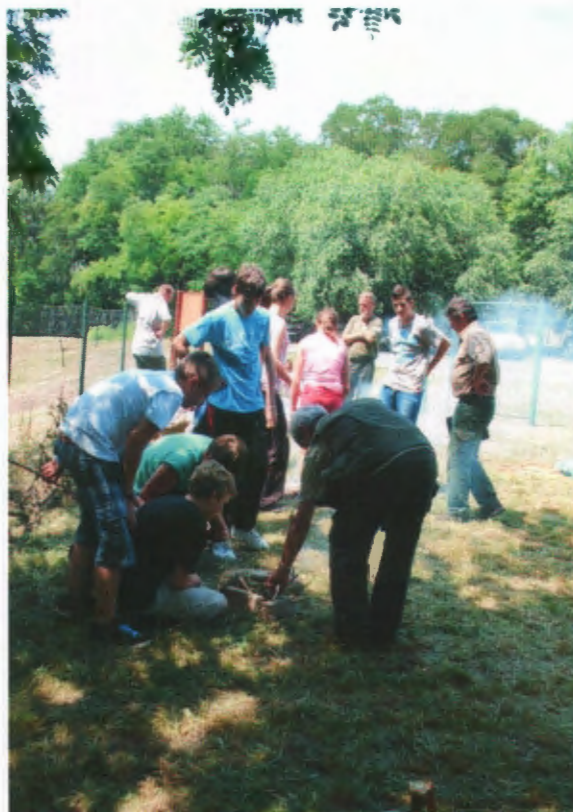
Tűzgyűjtési feladat a környezetvédelmi vetélkedőn

Immár hagyományosnak tekinthető hogy szolgálatunk kihelyezett Természetismereti órát tart iskolások részére. Ennek keretében Mezőőreink körbevezetik a gyermekeket az említett tanösvényeken, ahol röviden megismertetik a gyerekeket a hely élővilágával majd zárás képpen egy kis tudáspróba keretében számot adhatnak a megszerzett ismereteikről. Legutóbbi ilyen eseményünk 2012. június 8-án volt a Naplás-tavi tanösvénynél.