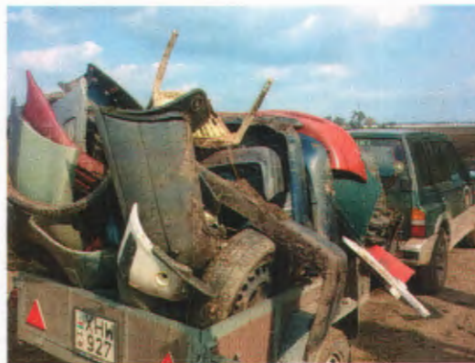
„Elveszett” autóalkatrészek gyűjtése egy természetvédelmi területen

Az elmúlt három évben a Rákosmenti Mezei Őrszolgálatnak bőven akadt munkája a rábizott külterületek őrzését illetően. A közel 6 500 hektáron működő őrszolgálat feladatának tekinti az illegális szemetelők és téli tüzelőt az erdőkből önkényesen beszerző fatolvajok elfogását is.