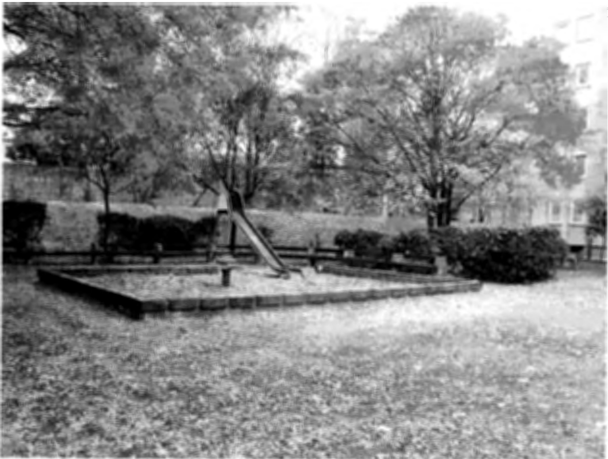
Gyakorló u. 15-17.