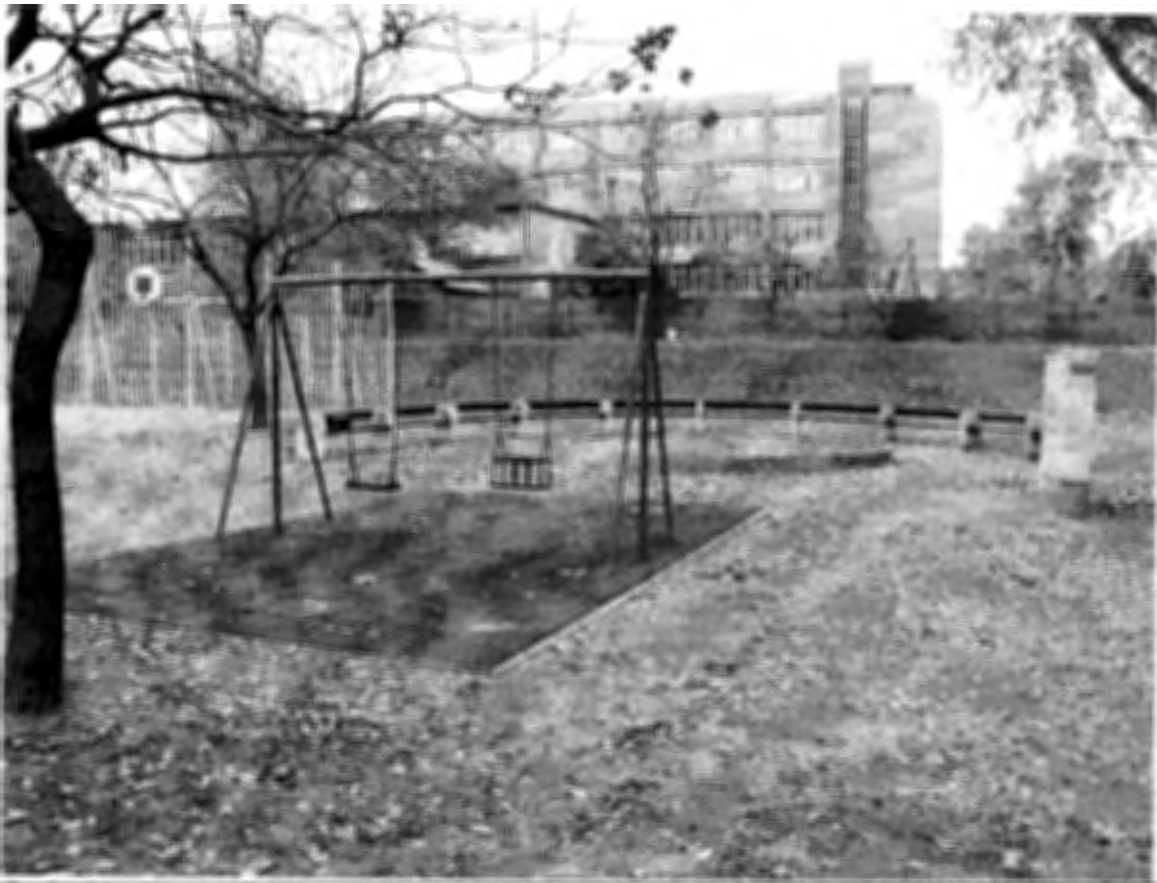
Gyakorló u. 11-13.