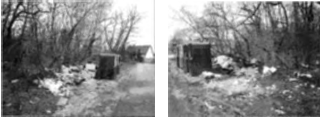
Bp., X. Hangár utcai szelektív hulladék-gyűjtősziget