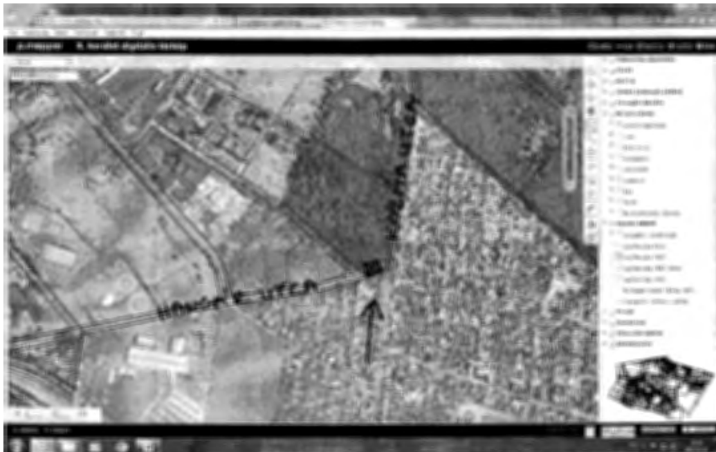
Bp., X. Hangár utcai szelektív hulladék-gyűjtősziget elhelyezkedése