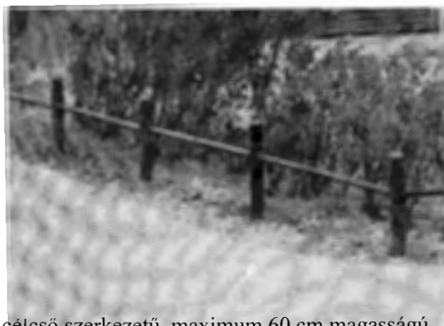
Acélcső szerkezetű, maximum 60 cm magasságú (az Üllői út 169. épületnél látható)