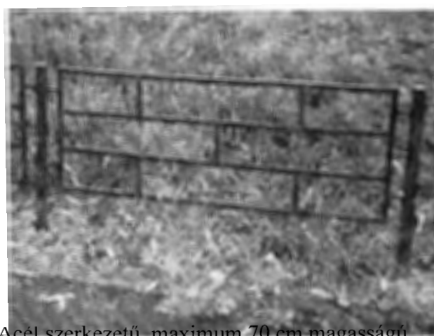
Acél szerkezetű, maximum 70 cm magasságú (a Kőrösi Csoma Sándor Kőbányai Kulturális Központ előtt látható)