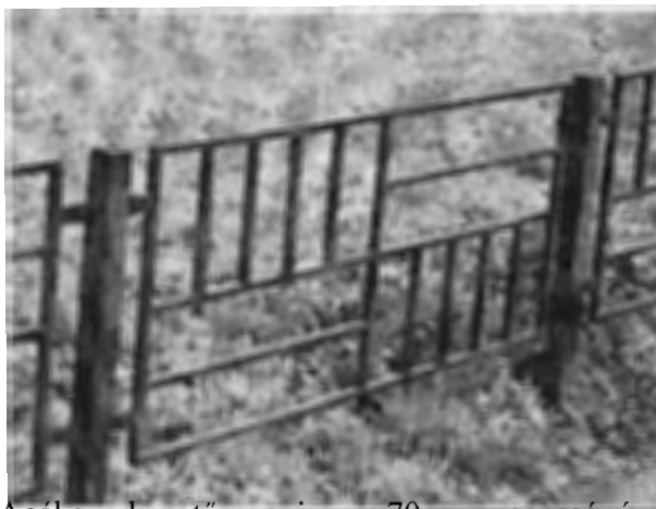
Acél szerkezetű, maximum 70 cm magasságú (a Kőrösi Csoma Sándor Kőbányai Kulturális Központ előtt látható)