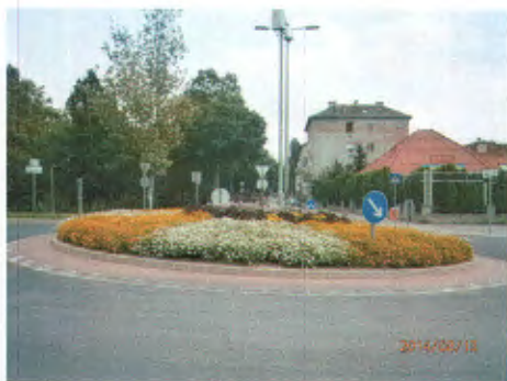
Tavasz utca – Mélytő utca körforgalom

A KÖKERT Kft. a kerület több közterületén ültetett el egyházi virágokat az akció keretében, többek között a Kőrösi Csoma sétányon, a Polgármesteri Hivatal előtt, a Magyar oltár környezetében, a Balkán utcában, a Mádi utca – Gitár utca körforgalomnál, a Csósztorony körforgalomnál, a Kozma utcai temető előtt, a Kápolna téri körforgalomnál, a Bányató utca – Tavasz utca körforgalomnál és a Kőér utca – Óhegy utca körforgalomnál.