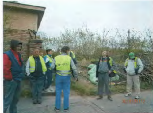
Algyógyi utcai helyszín