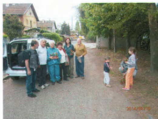
MÁV-lakótelepi munka résztvevői