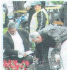
Kovács Róbert polgármester is részt vett a sok ezer virág kiosztásában

Ezt mondta Kovács Róbert, Kőbánya polgármestere azon a dísznövényosztáson, amelynek keretében a környezetükre igényes lakók és lakóközösségek az önkormányzati képviselők, a Kökerti és a polgármesteri hivatal munkatársainak segítségével kaptak virágokat, sövény- és díszcserjéket. A lakók az önkormányzat, pontosabban a Környezetvédelmi Bizottság által meghirdetett pályázat keretében korábban igényelték dísznövényeket egy-egy konkrét terület (kert, utcacsész, közös terület) szebbé tételéhez, s a bizottság döntése szerint szinte mindenki meg is kapta a növényeket.