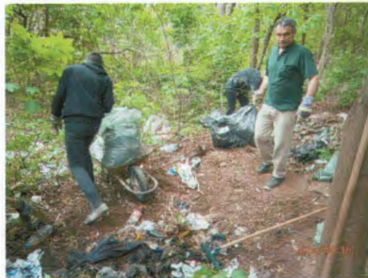
Gyakorló utcai erdő (Keresztury Dezső Általános Iskola mögötti) helyszín