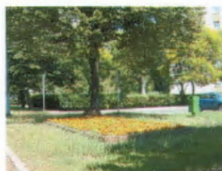
Zsombék utca – Mádi u.

Az elmúlt évekhez hasonlóan idén is a korábbi időszakban szemetes helyszíneken virágpalánták ültetésére került sor. Ezek a helyszínek a következők voltak: Zsombék utca – Mádi utca sarok, Mádi utca – Harmat köz sarok, Bihari út – Balkán utca sarok és a Gutor tér.