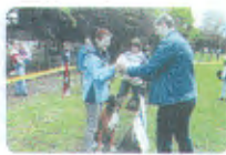
Polgármesteri előzetes a kategóriákért valószínűleg...