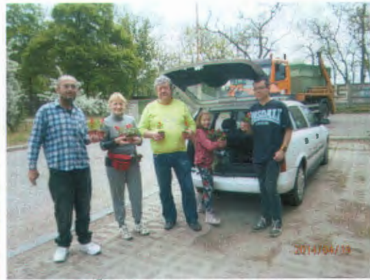
A résztvevők egyényi virágot kaptak a KŐKERT Kft.-től

A Büntetés-végrehajtási Intézetből (a továbbiakban: BVI) 20 fő csatlakozott a lakossági szemétyűjtéshez. A Hangár utcai erdőből a BVI által összegyűjtött szemetet a programhoz kapcsolódva a Pilisi Parkerdő Zrt. Budapesti Erdészete szállította el.