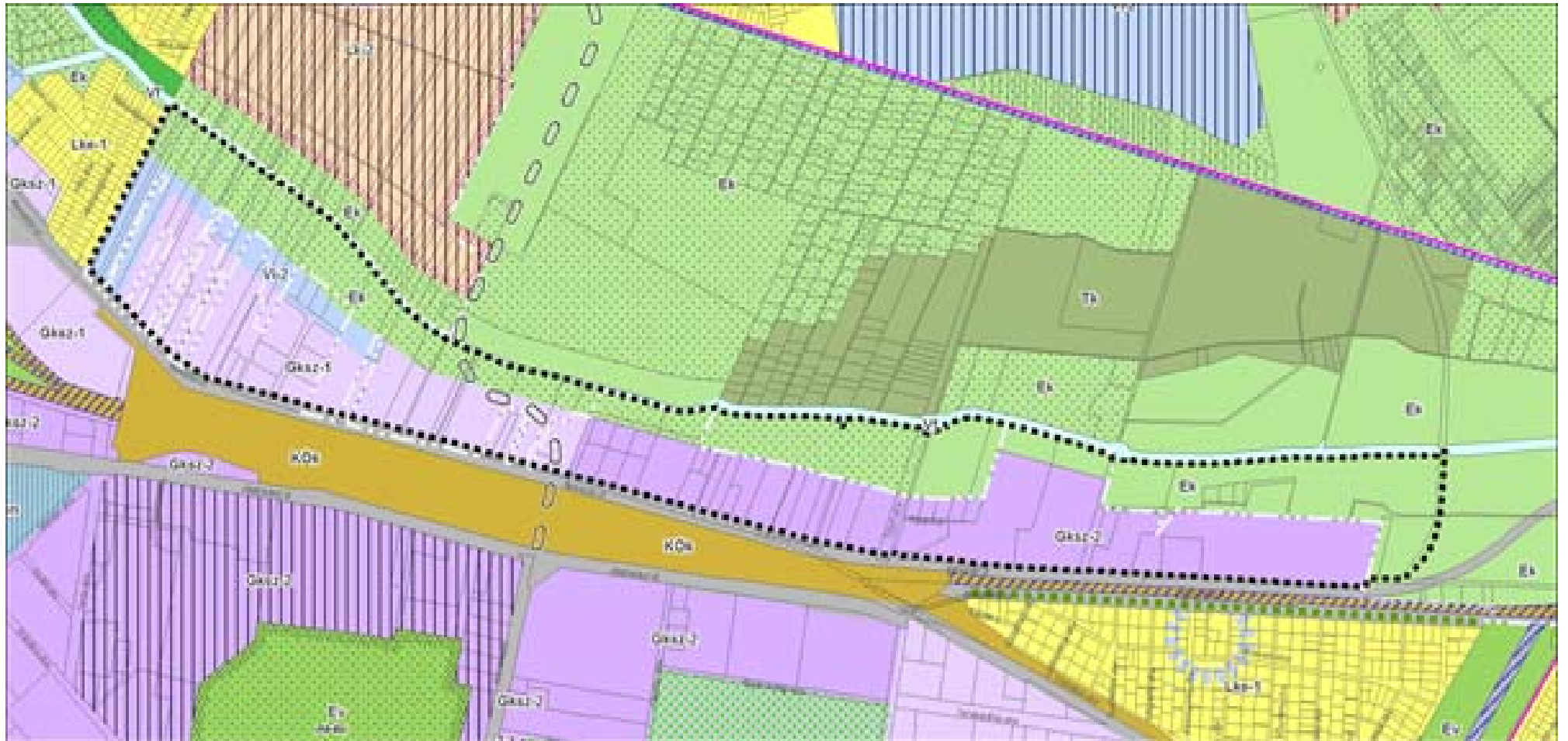
Keresztúri úti terület lehatárolása