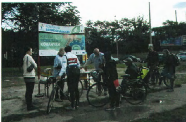
Kőbányai út – Pongrác út