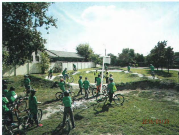
„pumpa és „dirt” pálya

A gyerekek helytörténeti és környezetvédelmi ismereteket tartalmazó keresztrejtvény megfejtésével mérhették össze tudásukat. A rejtvényt a Városüzemeltetési Osztály készítette, a helyszíni lebonyolításában a Jegyzői Főosztály munkatársai is részt vettek. A szellemi vetélkedést KRESZ-tóval segítette a X. kerületi Rendőrkapitányság.