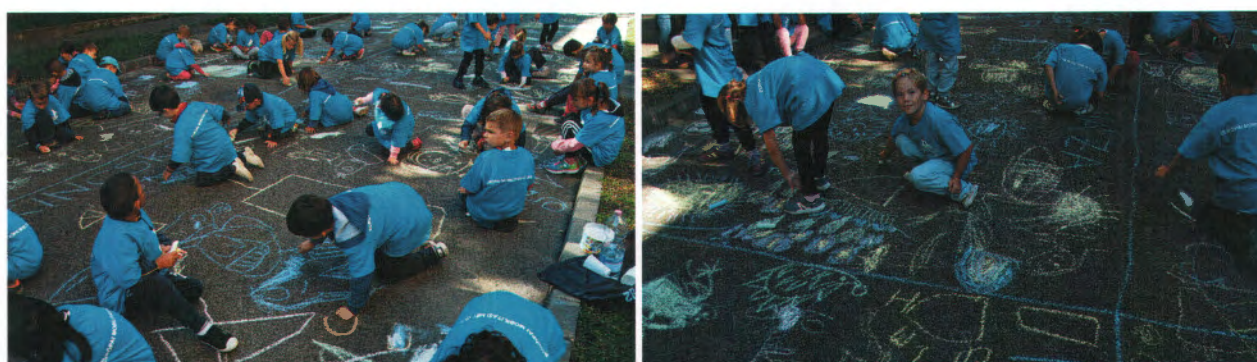
Óvis aszfalrajz verseny a lezárt Ászok utcában