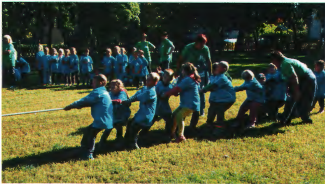
óvodás kötélhúzó verseny