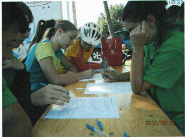
helytörténeti és környezetvédelmi állomás