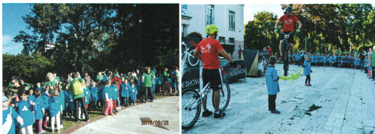
Óvodás program kezdete – kerékpáros bemutató a KÖSZI előtt

Az óvodások részére az „Autómentes Napon” a gépkocsiforgalom elől teljesen lezárt Ászok utcában és a KÖSZI előtti parkban kerékpáros bemutatót rendezett a Vuelta Kft., és ügyességi versenyeket tartott a Kocsis Sándor Sportközpont.