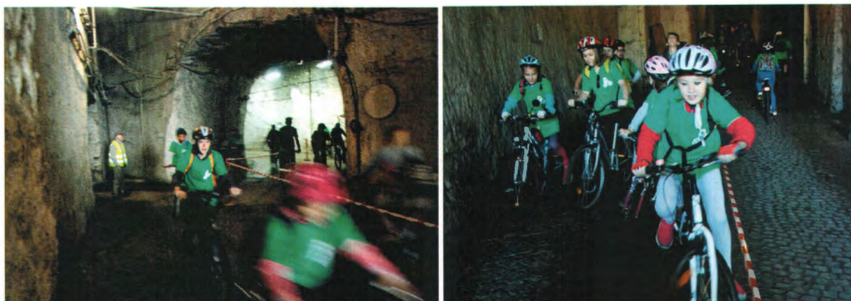
Kerékpártúra a pincében

Az óvodások részére az „Autómentes Napon” a gépkocsiforgalom elől teljesen lezárt Ászok utcában és a KÖSZI előtti parkban kerékpáros bemutatót rendezett a Vuelta Kft., és ügyességi versenyeket tartott a Kocsis Sándor Sportközpont.