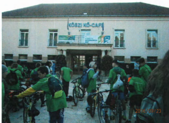
Gyülekező a KÖSZI előtt