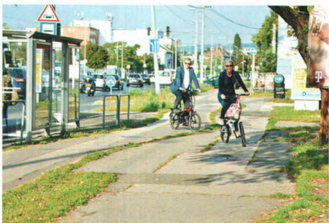
Kőbányai út – Pongrác út