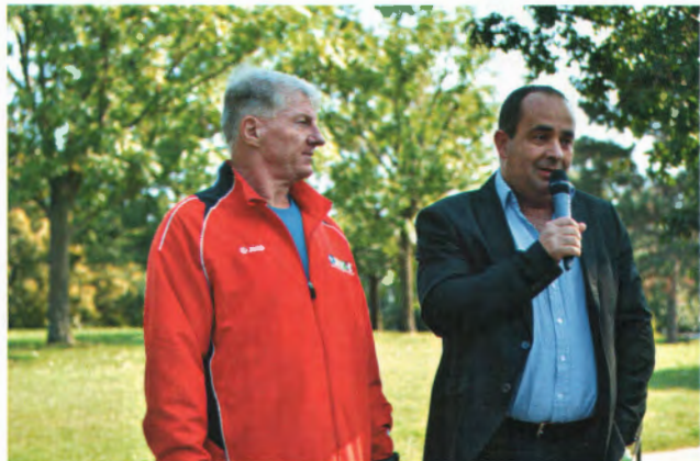
Radványi Gábor és Nagy István megnyitója

Az Európai Mobilitási Hetet a Fussunk Kőbányáért! rendezvény nyitotta meg 2016. szeptember 21-én 10 órakor. A futóversenyt a Kőbányai Sportközpont szervezte a kerületi általános iskolások részére. A 2016 métert 100 tanuló futotta le az Óhegy parki futókörön. A bemelegítésen részt vett a Bertendaz Hungary képviselője is, aki egy rövid bemutatóval egybekötve mutatta be a gyerekeknek a street workout pálya eszközeinek helyes használatát. Az eseményt Radványi Gábor alpolgármester nyitotta meg.