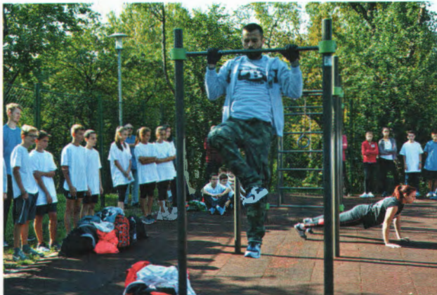
Bartendaz Hungary bemutatója