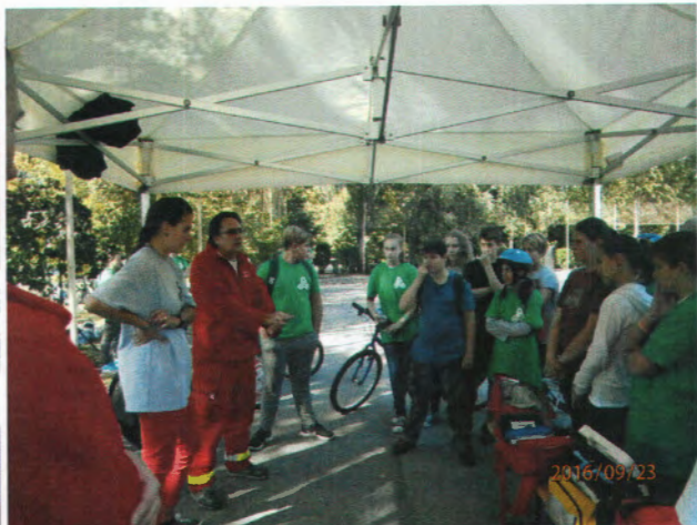
szlalompálya - elsősegélynyújtó oktatás