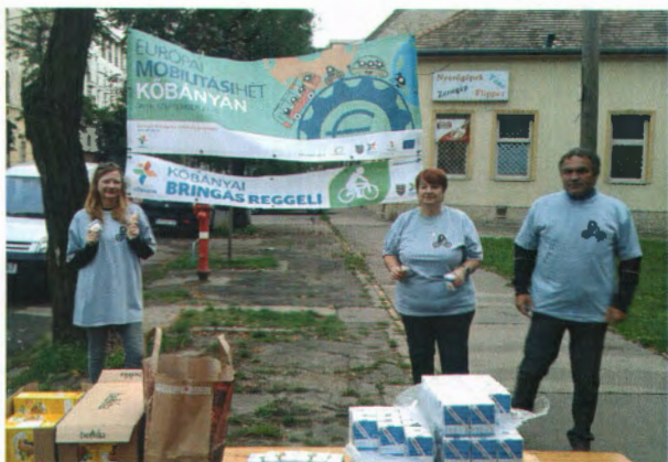
Ónodi u. – Kolozsvári u.