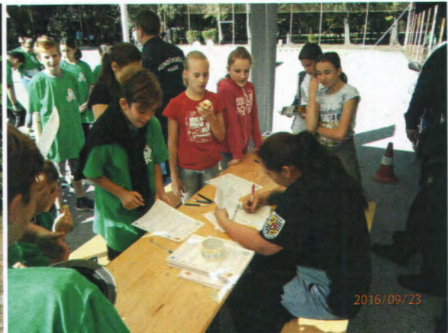
Brínga regisztráció és KRESZ-állomás