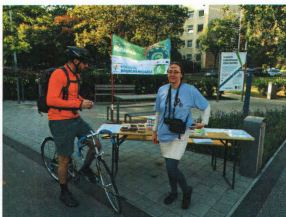
Harmat u. – Sibrik Miklós u.

A 2016. szeptember 23-ai Autómentes Nap a Kőbányai Polgármesteri Hivatal, a Kőbányai Torna Club, a Kocsis Sándor Sportközpont, a BRFK X. kerületi Rendőrkapitánysága, továbbá a Kőrösi Csoma Sándor Kőbányai Kulturális Nonprofit Kft., a Hungary Ambulance Kft., a Kőbányai Vagyonkezelő Zrt., a KÖKERT Kőbányai Non-profit Közhasznú Kft., a Bohus Biztonsági Szolgálat Információs és Szolgáltató Kft., a Safety Hungary Kft., valamint a Vuelta Kft. közreműködésével valósult meg. Az immár hagyománnyá vált, nagyszerű rendezvényen 13 óvodából, 10 általános iskolából és 5 középiskolából összesen több mint 600 gyermek, valamint a kísérőkkel, rendezőkkel és érdeklődőkkel együtt csaknem nyolcszázan vettek részt. Ez a létszám a tavalyinál valamivel nagyobb volt. A Kőbányai Ifjúsági és Szabadidő Központ (a továbbiakban: KÖSZI) előtt gyülekezett a programon résztvevők serege már reggel 8 órától. Itt kapták meg az ovisok és az iskolások a logóval ellátott pólókat.