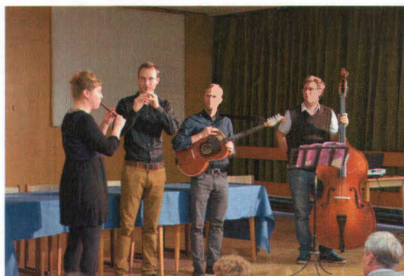
Króó György Zeneiskola tanári formációja