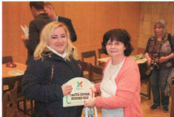
pillanatképek a díjátadásról