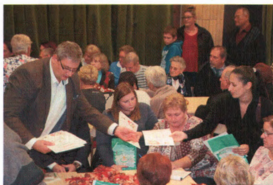
Polgármester úr átadja az okleveleket