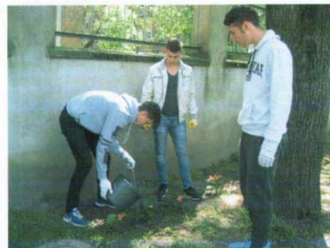
Munkavégzés közben az iskolások (Pataky I. Szakközépiskola)