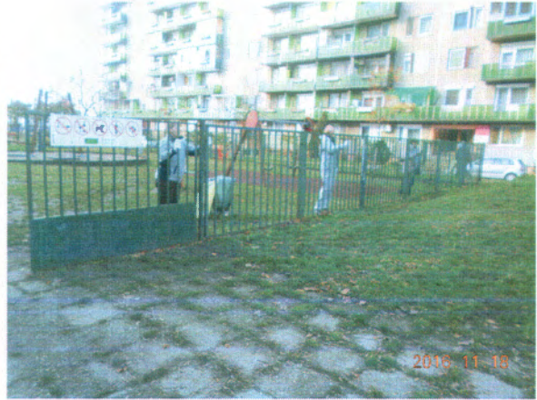
... munka közben...