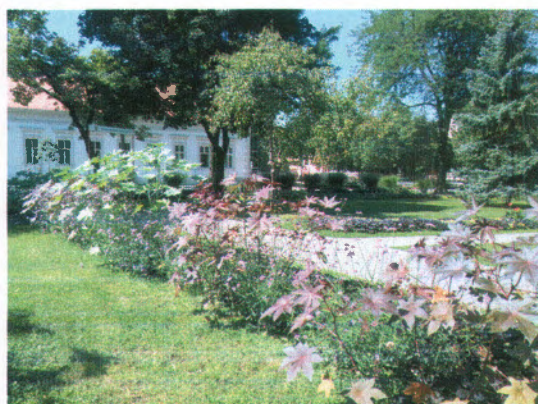
Kiültetés a Szent László szobornál és a Polgármesteri Hivatal előtti parkban

A kerületben élők környezetének szépítéséhez – a lakosság körében nagyon kedvelt akció keretében – idén is virág- és fűszerpalánták, valamint fiatal díszcserjék osztásával járult hozzá az Önkormányzat.