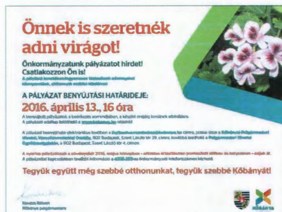
A pályázati felhívás