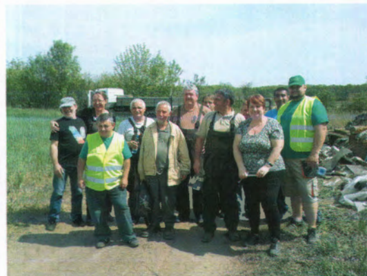
Az utolsó percig kitartó csapat

A Büntetés-végrehajtási Intézetből (a továbbiakban: BVI) 10 fő csatlakozott a lakossági szemétygyűjtéshez. A Hangár utcai erdőből a BVI által összegyűjtött szemetet a programhoz kapcsolódva a Pilisi Parkerdő Zrt. Budapesti Erdészete szállította el.