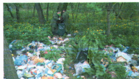
Hangár utcai erdő takarítása