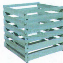
újrahasznosított műanyag komposztáló keret