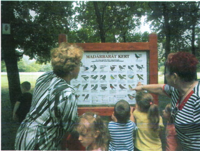
A tájékoztató táblát tanulmányozzák a tanösvény megnyitóján