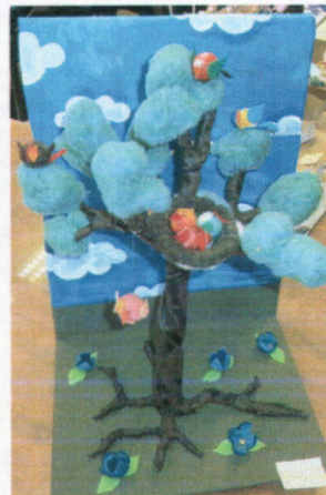
A két különdíjas alkotás.

Szintén e jeles naphoz kapcsolódva az Óhegy parkban egy új „ Madárbarát mintakert tanösvény ” létesült . A Magyar Madártani és Természetvédelmi Egyesület által összeállított mintakert tanösvény segítségével már nemcsak a Mélytő mellett, hanem az Óhegy parkban is láthatóak a különböző fajta odúk és egyéb, a madárbarát kertben szükséges eszközök.