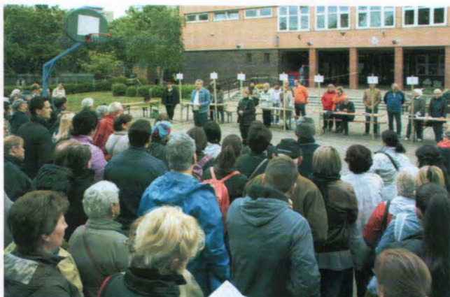
A növényosztás megnyitója

Az óriási számú jelentkező is bizonyítja, hogy Kőbányán a környezet szépítése, virágosítása az itt élők szívügye.