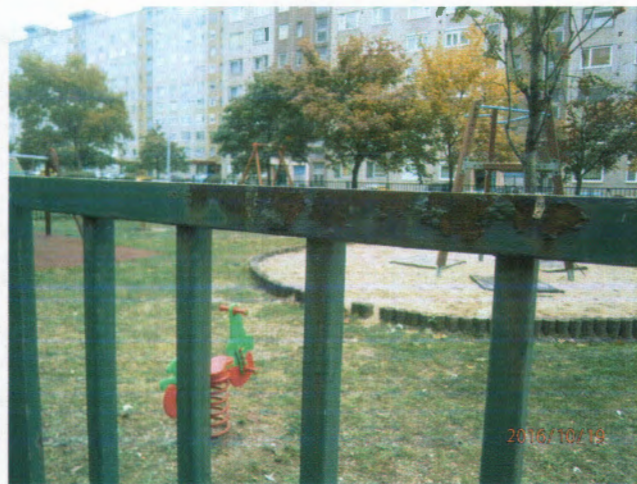
Harmat u. 142. játszótér kerítés festés – munka előtt