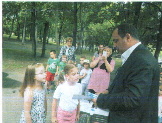
A képzőművészeti verseny díjátadása a tanösvény megnyitóján

A „Keressük Kőbánya legszebb fáját – 2016” akcióban a helyi lakosok, intézmények, vállalkozások tehettek javaslatot egy-egy arra érdemes fára. Sajnos idén csak két javaslat érkezett (mindkettő ugyanolyan fára), ezért nem került sor szavazásra. A jövő évi akció során ezt a két jelölt fát is figyelembe fogjuk venni.