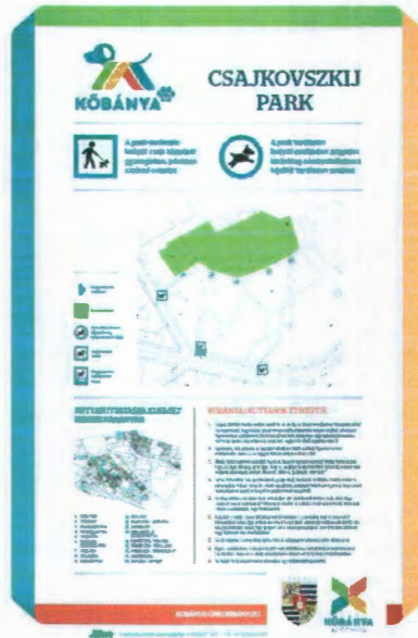
nagyméretű (B1) tábla a Csajkovszkij parkban