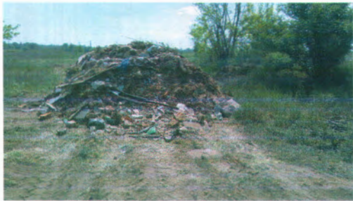
Géppel összetolt hulladék a Dömsödi utcában