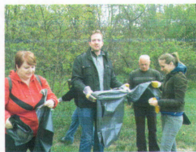
Dömsödi utcai erdőnél