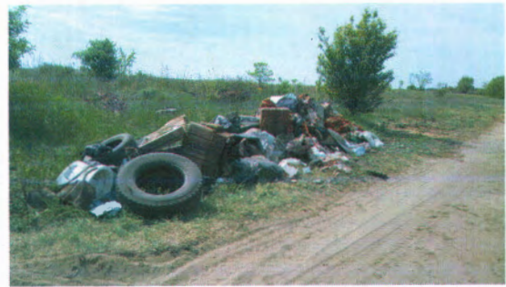
Az összegyűjtött hulladék kupacok a Dömsödi utcánál