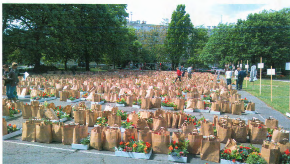
Átadásra előkészített csomagok