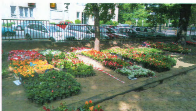
Társasházaknak előkészített növények