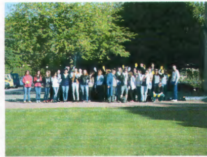
32 diák gyűjtötte a szemetet a Magyar Gyula Szakképző iskolából