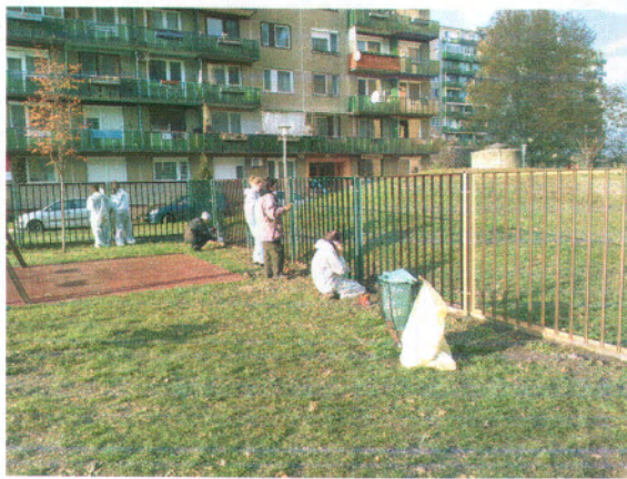
... és az utolsó simításoknál.