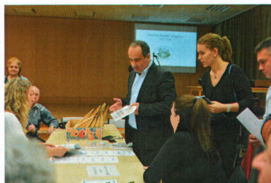
pillanatképek a díjátadásról