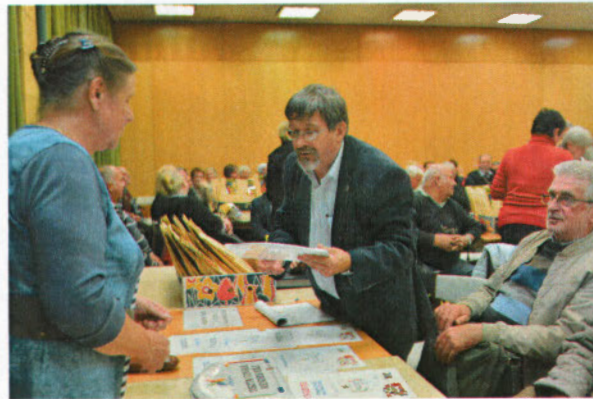
pillanatképek a díjátadásról

Az ünnepségen a „Legszebb konyhakertek” országos program kőbányai helyi versenyének értékelése is megtörtént. 2017-ben 11 pályázó vette át az elismerő oklevelet.