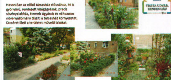
példa egy családi ház és egy társasház értékelésére