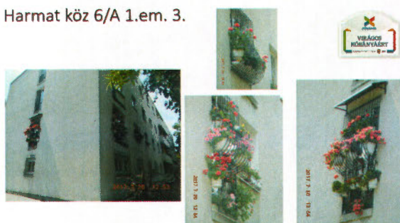
példa egy vállalkozás és egy erkély értékelésére