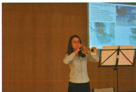
Tutta Forza zenekar trombitása