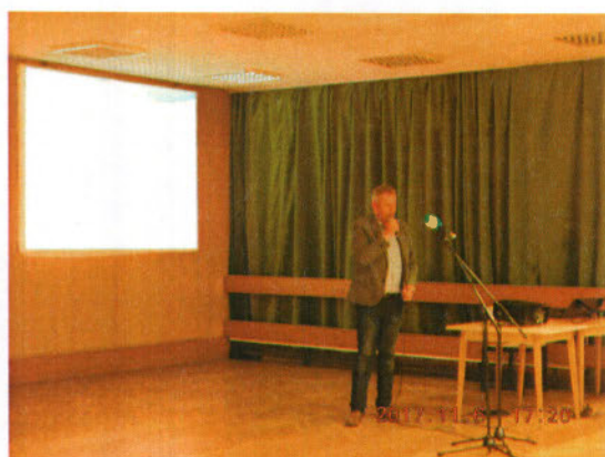
előadás a japánkertekről