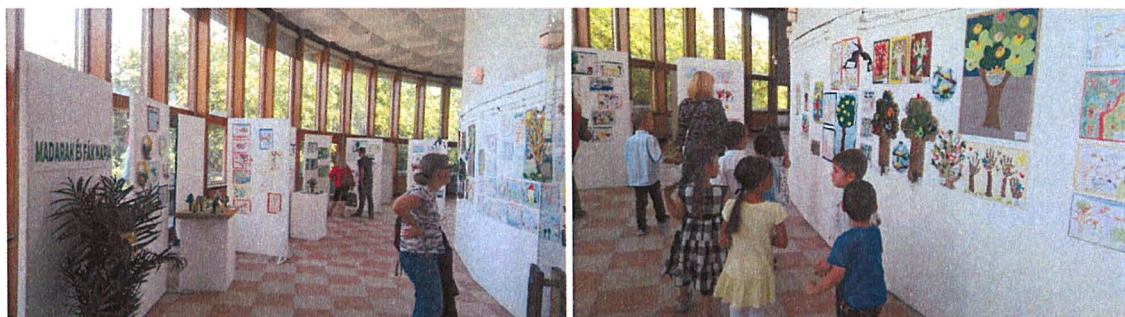
Az alkotásokból a Kőrösi Csoma Sándor Kőbányai Kulturális Központban készült kiállítás

A Madarak és Fák Napja akcióhoz kapcsolódva 2018. év végéig Kőbánya néhány érdekes közterületi fájához tájékoztató tábla kerül kihelyezésre. A táblán rövid tájékoztatás olvasható, a QR kód beolvasásával az érdeklődő a fajtajáról egy hosszabb ismertetést tud elérni.