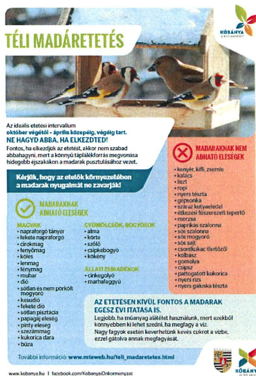
A téli madáretetésről szóló tájékoztató tábla