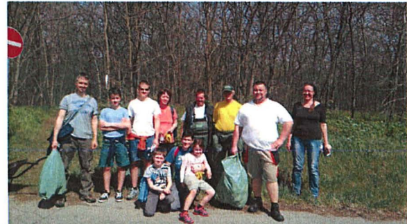
Hulladékgyűjtés az Álmos utcai erdőben