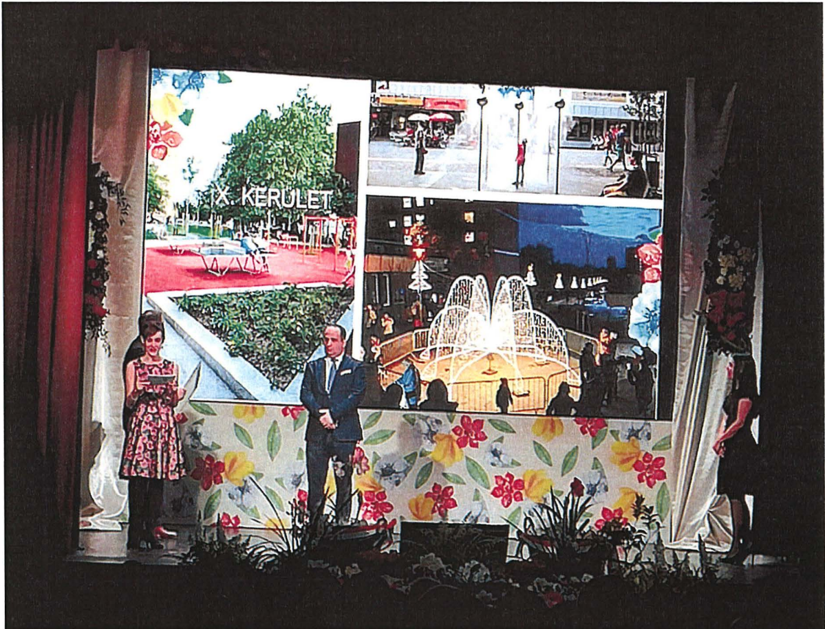
A nagykőrösi díjátadó ünnepségen