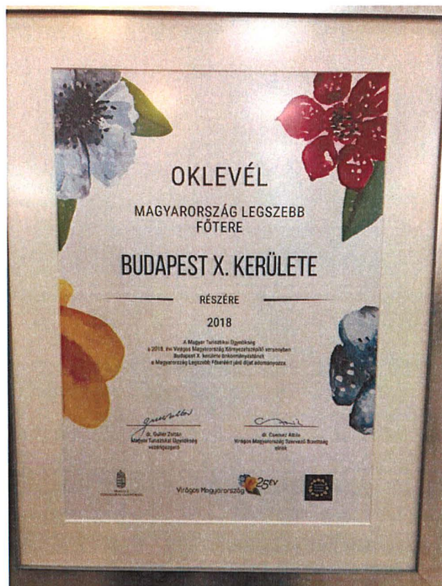
Az elismerő oklevél

A 2018. évi kerületszépítő akciók sikeresek voltak, hozzájárultak Kőbánya rendezettebbé, esztétikusabbá tételéhez, emellett a sok résztvevőt megmozgató események közösségformálása is jelentős volt.