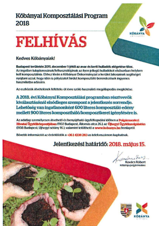
Komposztálási pályázat felhívás

A 2017. évi beszámolók összesítése alapján 2017-ben Kőbányán a lakosok mintegy 144 tonna zöldhulladékot komposztáltak, amelyből közel 81 m 3 komposzt keletkezett.