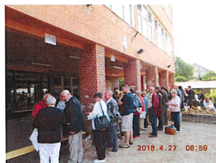
Az átadásra várók sora