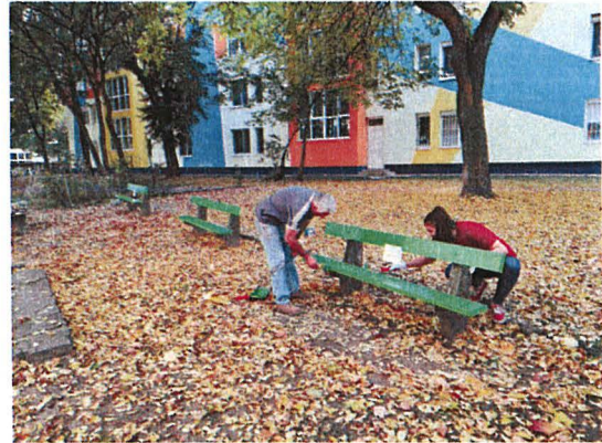
A padok festése közben