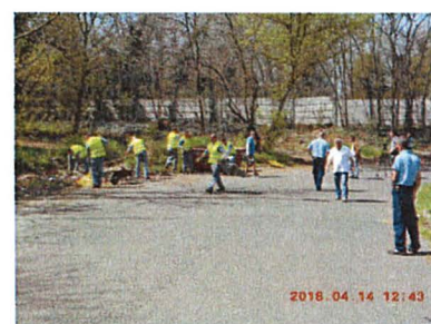
Nagy mennyiségű hulladék összegyűjtése