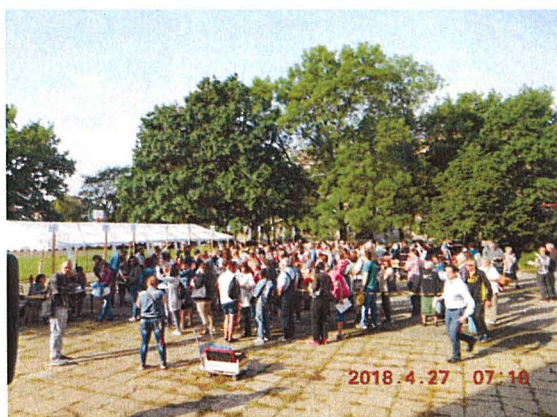
Kiosztólapok átadása a pályázók részére