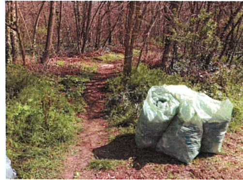
A megtisztított erdő egy része