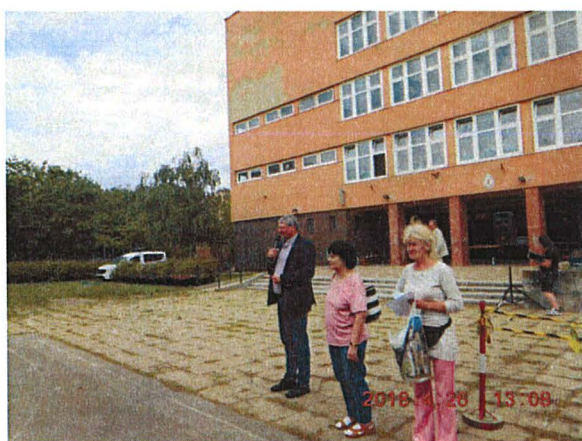
A növényosztás megnyitója

Az óriási számú jelentkező is bizonyítja, hogy Kőbányán a környezet szépítése, virágosítása az itt élők szívügye.