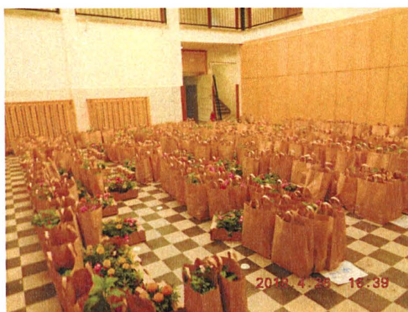
Átadásra előkészített csomagok