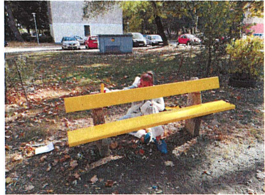
A padok festése közben