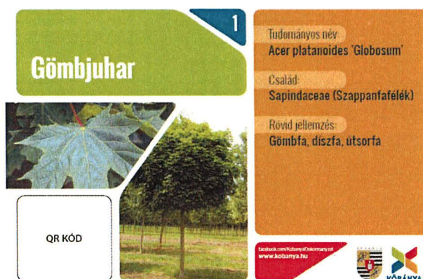
Példa egy fajajt ismertető táblára

A madarak etetésében elsősorban a lakosság részvételére számítunk, de egy biztonsági eleség mennyiségről az önkormányzat a Mélytőnél a horgász egyesület, a másik két parkban pedig a KŐKERT Kft. bevonásával gondoskodik.