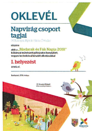
A pályaművek és az oklevelek közül egy-egy