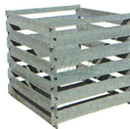
újrahasznosított-műanyag komposztáló keret