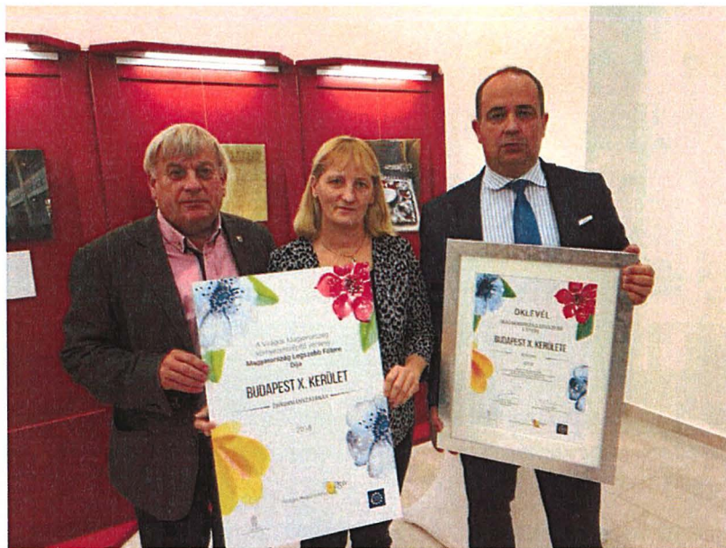
Az elismerő oklevelek