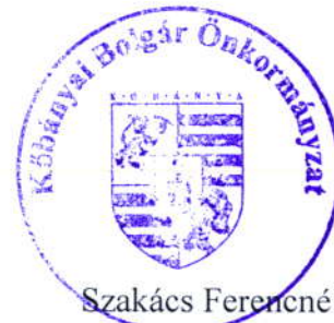
Szakács Ferencné elnökhelyettes