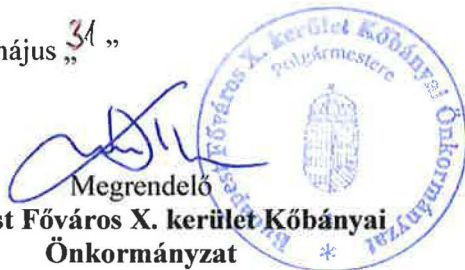
Megrendelő Budapest Főváros X. kerület Kőbányai Önkormányzat D. Kovács Róbert Antal polgármester

Budapest, 2021. május „31” Centrum Televízió Kft. 1105 Bp., Bánya u. 35. Adószám: 13770442-2-42 Bsz: 11600006-00000000-19525996