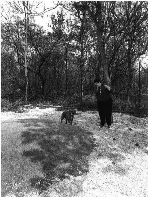
Kutyasétáltatás a HEROS-nál

Természetesen a rendszeres elfoglaltságok mellett külön szervezünk kirándulásokat, nyaralásokat, melyeken nagy örömmel vesznek részt az ügyfeleink. HEROS állatmenhelyen való munkavégzés.