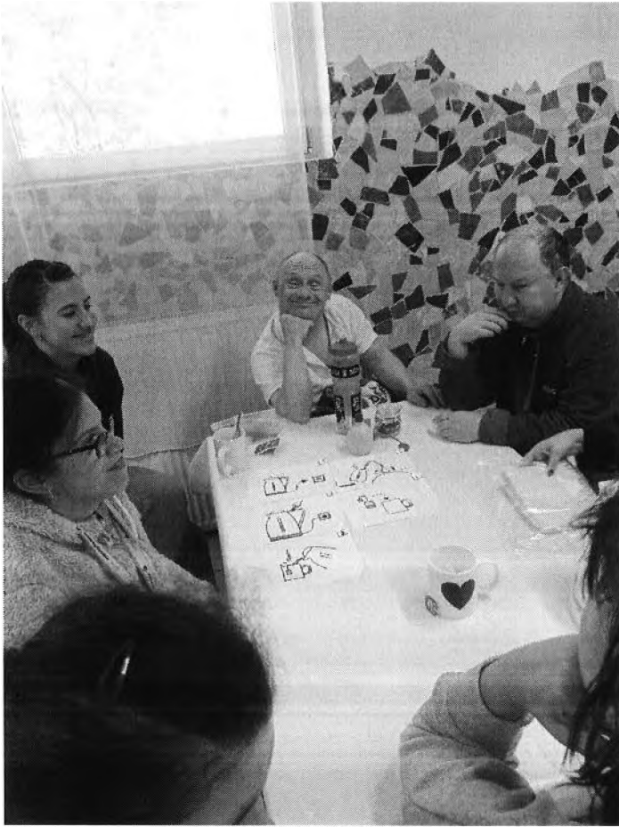
Vízmelegítő használatának tanulása gyógypedagógus hallgatók segítségével

A facebook oldalunkon indított hírlevelünket folytattuk „életképek” címmel, azzal a céllal, hogy betekintést nyújtsunk a mindennapokba, egy-egy pillanatképet megosztva.