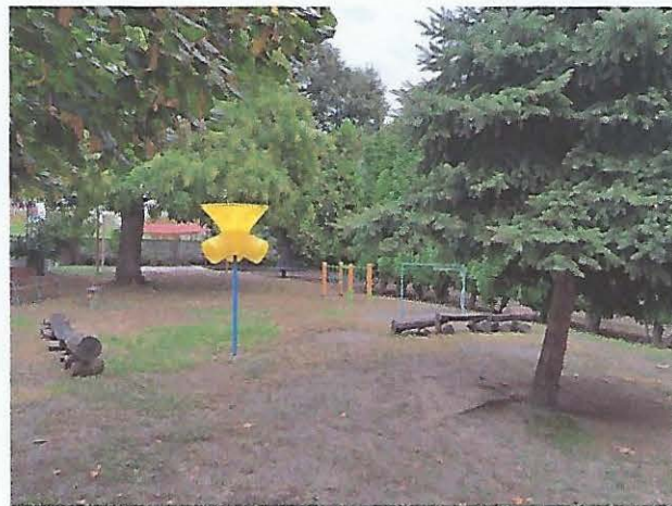
A maci csoport udvara