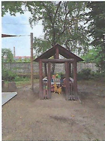
A jelenlegi kisház

Ennek az eszköznek a beszerzéséhez, megvásárlásához szeretném kérni a támogatását.