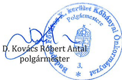
D. Kovács Róbert Antal polgármester